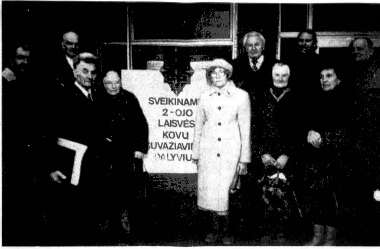
Laisvės kovų sąjungos suvažiavimo dalyvių grupelė Radviliškyje 1992 m. balandžio 19 d.

Lietuvos santykius su Rusija krikščionys demokratai grindžia suvokimu, kad Rusijos kontroliuojama Eurazijos politinė-ekonominė erdvė Lietuvai