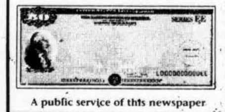
A public service of this newspaper