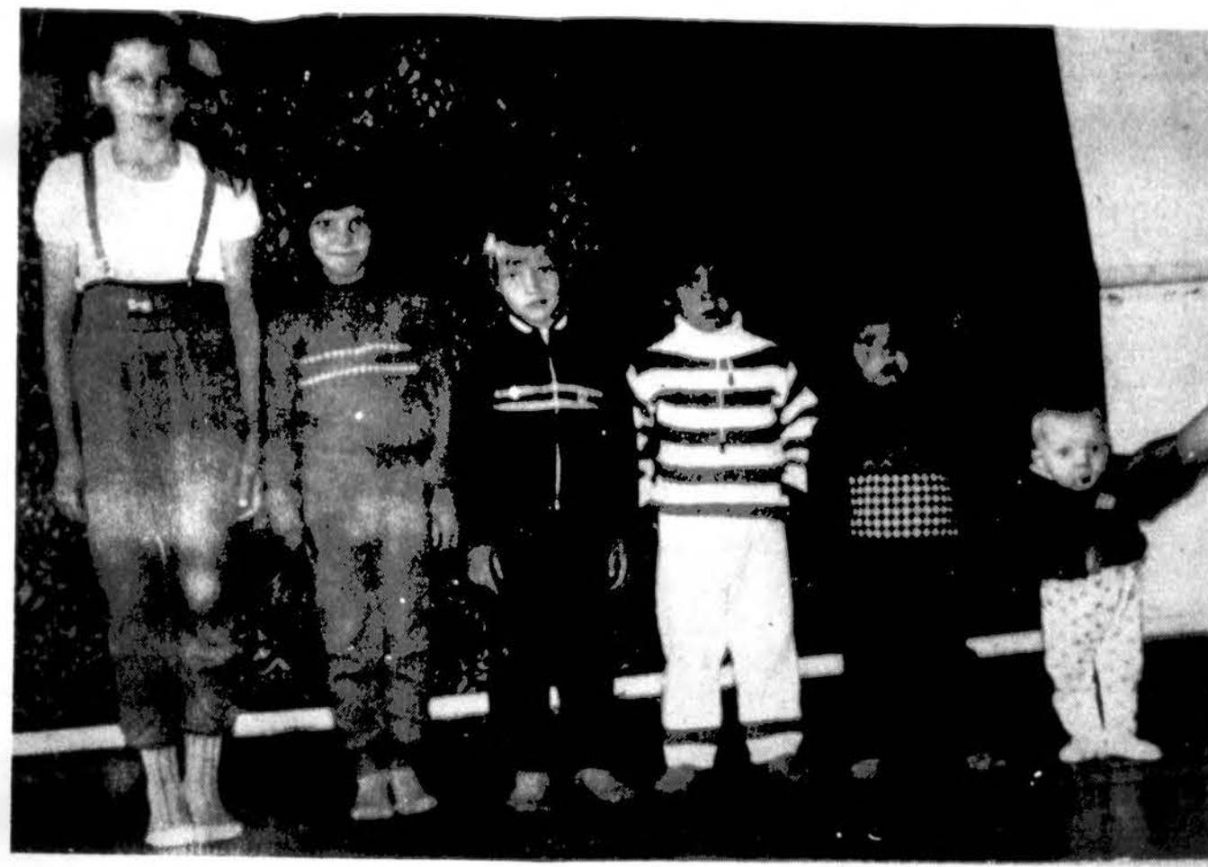
Tai senelio, grįžusio iš Sibiro, vaikaičių būrelis. Nuotrauka iš 1987 metų.