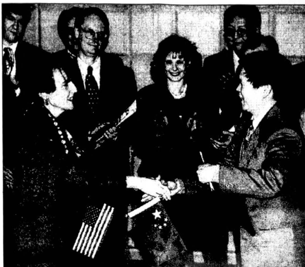
JAV derybų su Kinija vadovė Charlene Barshevsy (kairėje) ir Kinijos užsienio prekybos ministrė Sun Zheny sėkmingai baigė derybas sekmadienį ir jų šalys išvengė prekybos karo. Pasirašytoje sutartyje išsprendžiamas jau seniai besitęsiantis ginčas kaip Amerikai apsaugoti nuo neteisėto kopijavimo tokius gaminius kaip garso įrašai, kino filmai ir kompiuterių programos. Kinija išvengė grąsinimų sankcijų ir JAV importuojamoms jos prekėms, paskelbdama kokius apsunkinimus uždės tiems, kurie nelegaliai kopijuoja amerikietiškus gaminius, ir kaip palengvins sąlygas amerikietiškiems investicijoms Kinijoje.

Rusijos premjerui Viktor Černomyrdin dėl lenkų reakcijos pasisekė mažiau — keli šimtai žmonių prie Rusijos ambasados reikalavo nutraukti karą Čėčėnijoje, o per Černomyrdino susitikimą su Lenkijos premjeru Waldemar Pawlak du studentai iš Krokuvo pradėjo šiem pa-