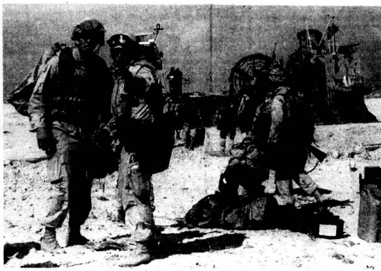
JAV marinai pirmadienį iškovė ginklus Mogadišo uoste, o pirmadienio naktį apie 1,800 karių išlipo iš karo laivų Somalijos pakrantėse, primindami pirmą išlipimą Somalijoje prieš dvejus metus. Šį kartą jų uždavinys — teikti apsaugą iš Somalijos išvykstantiems Jungtinių Tautų kariams — 2,500 Pakistano ir Bangladešo karių. Prieš dvejus metus pradėtos Jungtinių Tautų operacijos jau kainavo daugiau kaip 2 milijonai dolerių, ir nors bado Somalijoje nebėra, nėra ir centrinės valdžios. O valdžios norinčios somaličių grupės vos gali sulaukti, kol išvyks JT daliniai, kad galeto ginklu siekti valdžios. Numatoma, kad su JAV pagalba JT daliniai bus tvarkingai išvesti per dvi tris dienas.