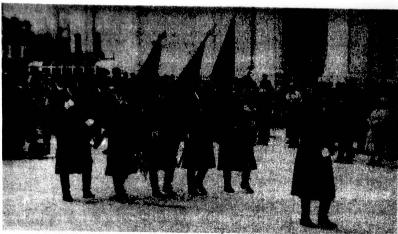
1994 m. spalio 30 d. Vilniuje paminėta sostinės atgavimo 55-oji sukaktis. Iškilmingoje eisenoje Katedros aikštėje nešamos vėliavos.