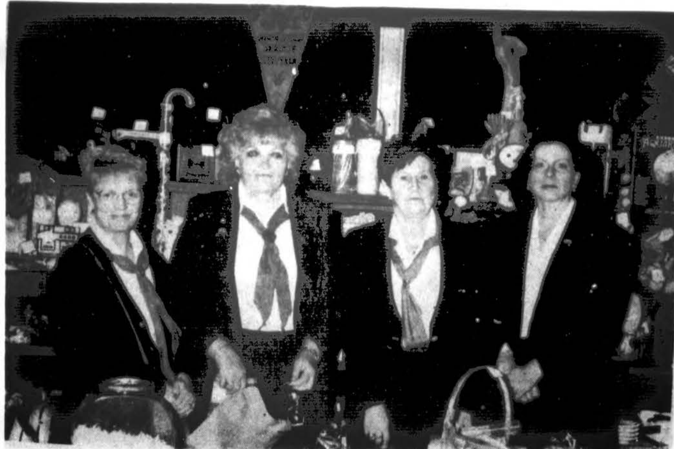
Sesės Čikagoje jau pasirošusios Kaziuko mugėi, kuri ši sekmadienį, kovo 5 d., vyks Jaunimo centre. Atidarymas – 11:15 val. r.