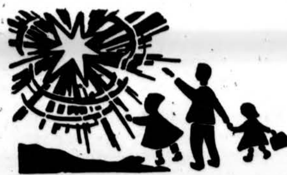
Redaguoja J. Placius. Medžiagą siųsti: 3206 W. 65th Place, Chicago, IL 60629

x Siuntiniai į Lietuvą laivu per TRANSPAK. Skubiems siuntiniams – AIR CARGO. Maisto siuntiniai nuo $29 iki $98. Produktai aukštos kokybės. Du populiariausi tai $35 šventinis siuntinys ir 55 sv. įvairaus maisto už $98. TRANSPAK, 2638 W. 69 St., Chicago, IL 60629, tel. 312-436-7772. (sk)