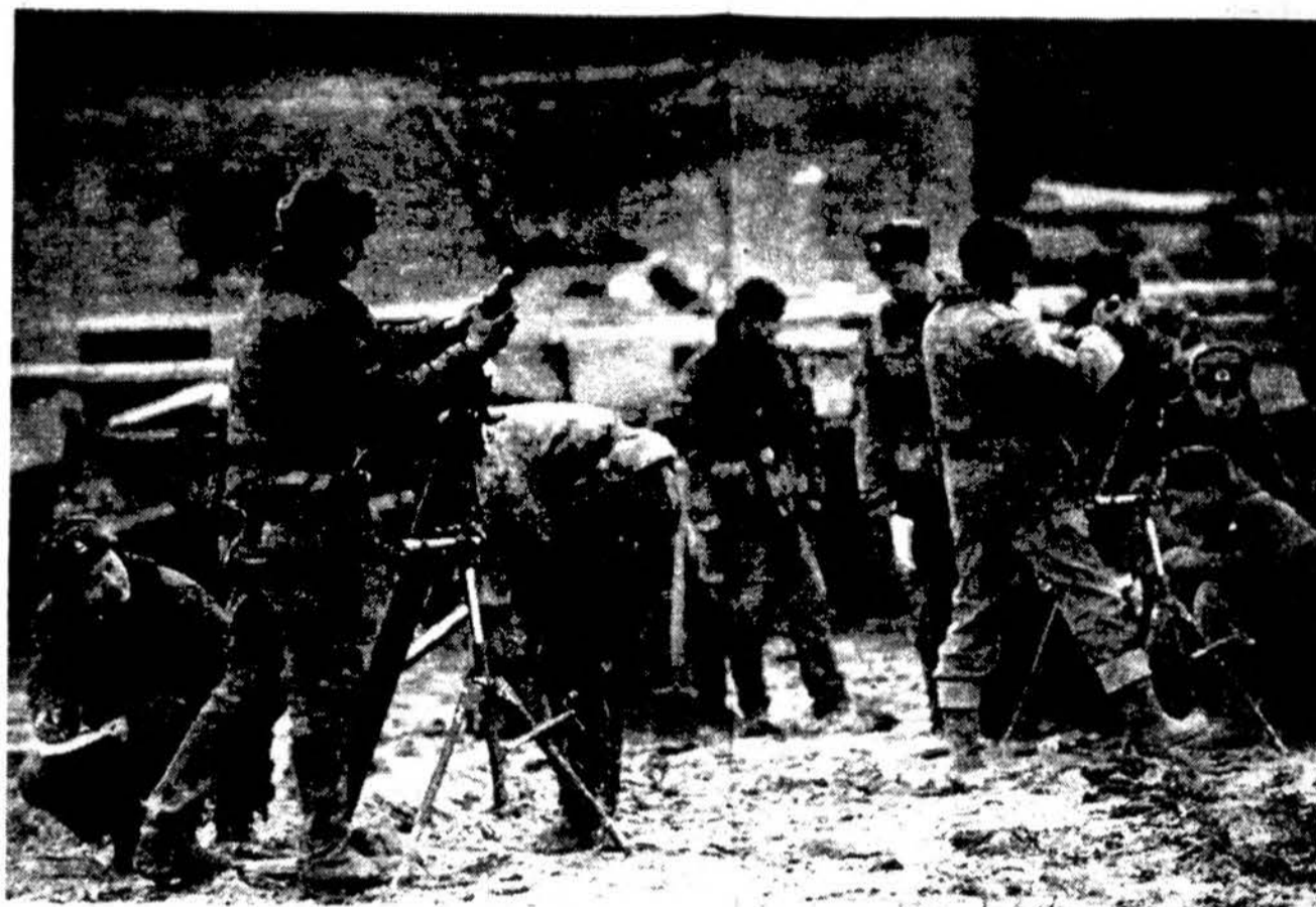
Rusijos karinė vadovybė pirmadienį pranešė, kad rusų pajėgos jau visiškai apsupo Čėčėnijos sostinę Grozną. Rusijos kariai deda šovinius ir mirtynus nustatytus į čėčėnų gynybų pozicijas Grozno priemiesčiuose. Antradienį Rusijos gynybos ministras Pavel Gračev pareiškė, kad po 11 savaitių kovos, rusai palaus čėčėnų rezistenciją. Tačiau rusams šaudant čėčėnų pozicijas į pietus nuo Grozno, Gračevas pripažino, kad čėčėnai persigrupuoja.