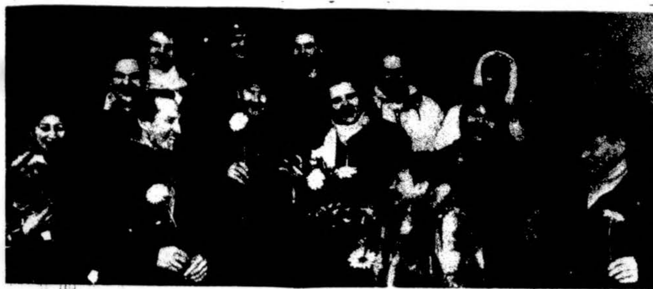
Lietuvoje su gėlimis buvo sutikti slidinėjimo varžybų, 8 m. vasario 23-24 d. vykusiu Collingwood, Ont., Kanadoje.