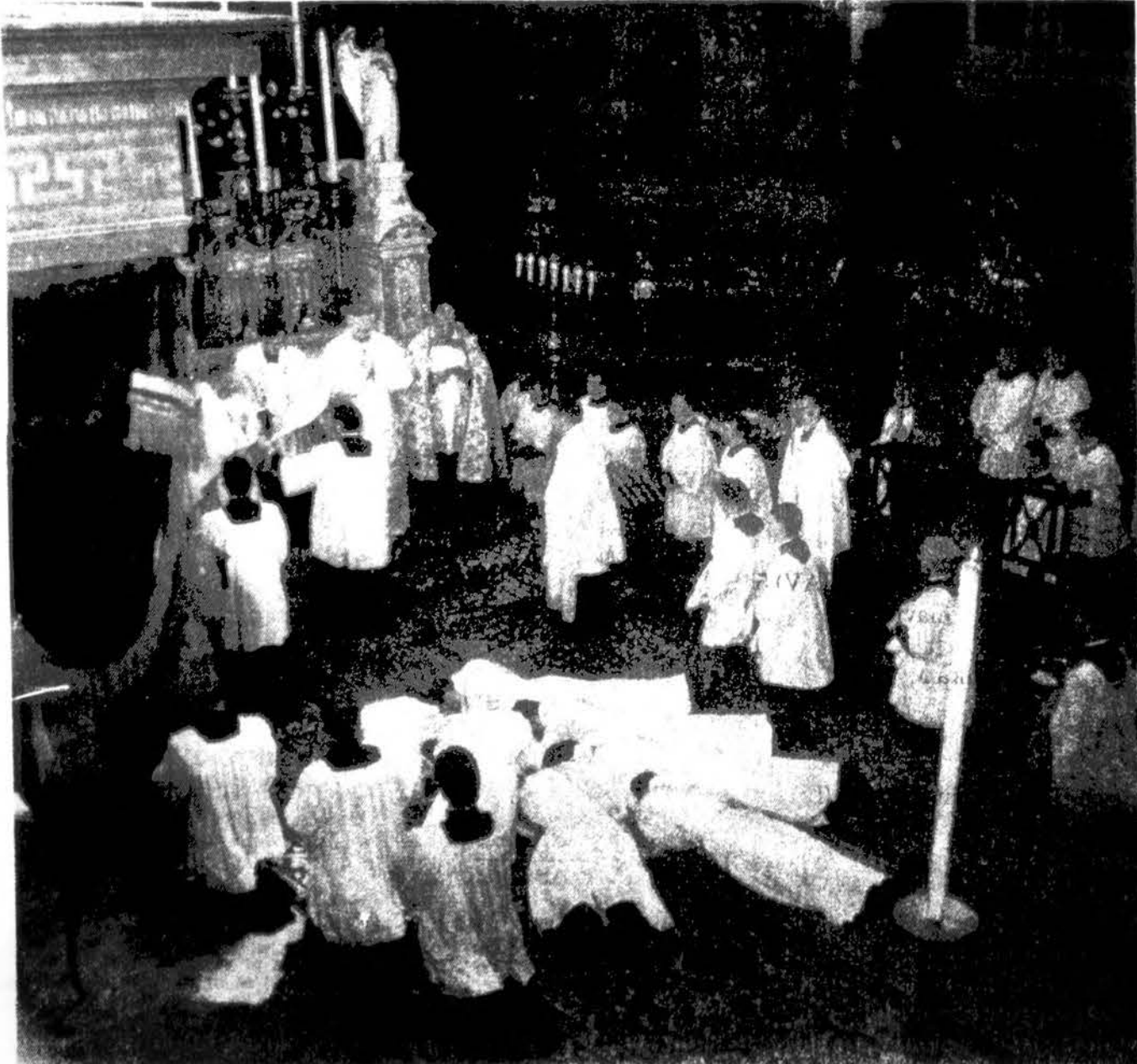
Kauno Tarpdiecizinės kunigų seminarijos auklėtinų kunigystės įvertinimo akimirka Kauno Arkikatedroje.

• 1895 m. sausio 5 d. vokiečių fizikas Wilhelm Roentgen paskelbė išradęs būdą peršviesti žmogų. Metodas pavadintas jo vardu – Rentgeno spinduliais.