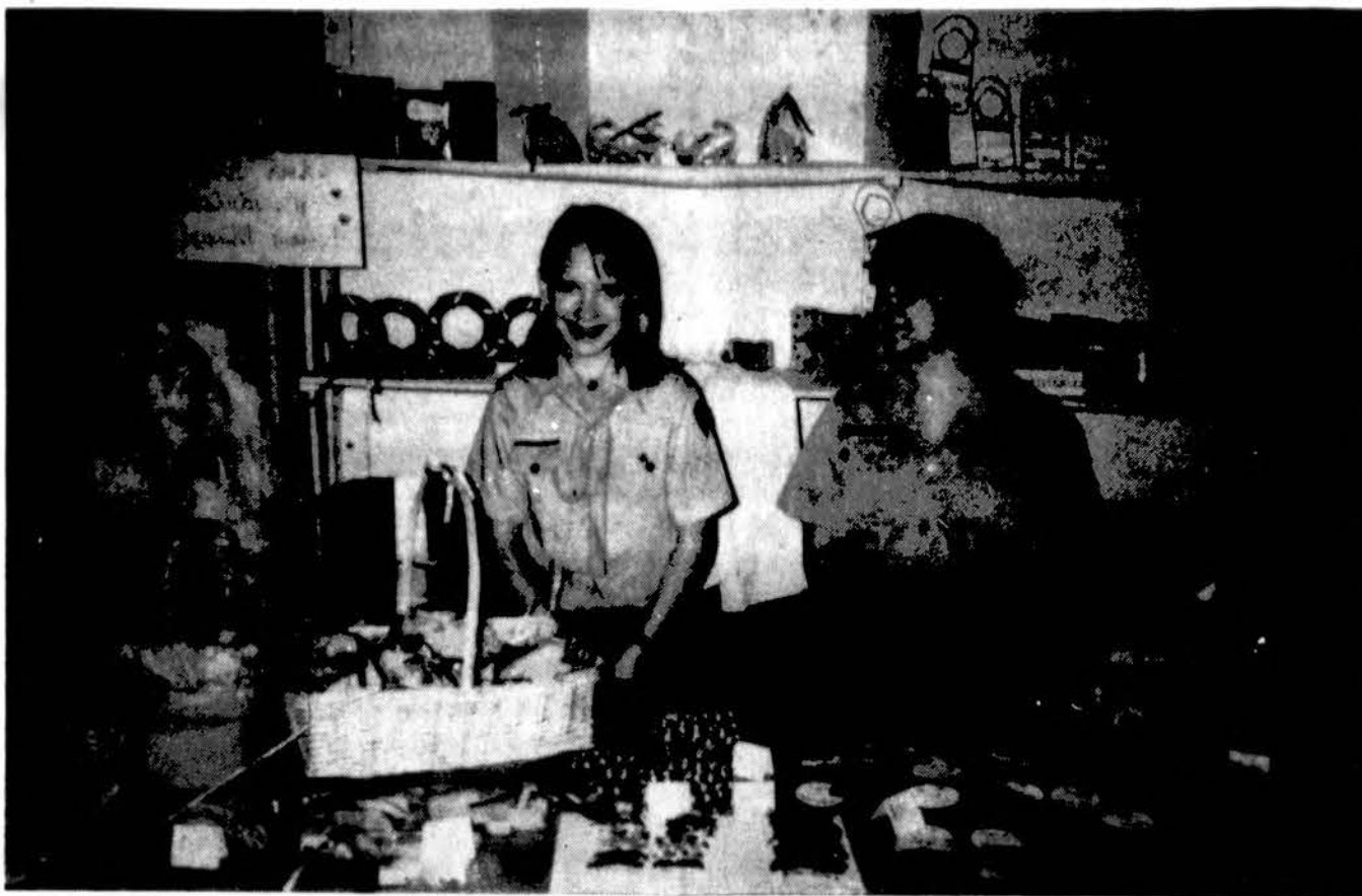
Detroito skautijos Kaziuko mugėje, kovo 5 d. vykusioje Dievo Apvaizdos parapijos patalpose, prie skautiškų darbelių prekystalio pirkėjų laukia darbdėšis „Gabijs“ tunto sesės.