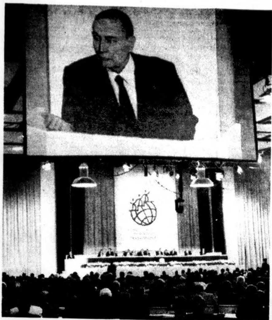
Kopenhagoje kovo 11 d. įvykusioje 115 valstybių vadovų konferencijoje kalbėjo Prancūzijos prezidentas Francois Mitterrand. Kalbėtojai buvo rodomi didžiuliam televizijos ekrane virš pulto. Mitterrand rėmė pasiūlymą įvesti naują tarptautinį mokesčių iš kurio būtų finansuojamas tarptautinio vystymo programos.

Ministerijos atstovė spaudai taip pat informavo, kad siekiant geriau organizuoti Lietuvos kariuomenės materialinį ir techninį aprūpinimą bei išvengti dubliavimo, panaikinta kariuomenės medžiaginio aprūpinimo tarnyba bei kariuomenės užnugarinio departamento. Vietoj panaikintų tarnybų įsteigtas Kariuomenės aprūpinimo departamentas — vadinasi, etatų skaičius čia sumažėjo 41 procentu.