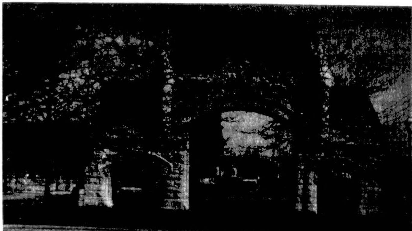
Šioje vietoje daugelis lietuvių, atvykusių į Ameriką dar praėjusio šimtmečio pabaigoje, surado darbo ir pradžioje savo nelengva gyvenimą išsivajotoje „pasaku“ šalyje. Nuotraukoje: iš gyvulių skerdyklų rajono Čikagoje belikę tik šie vartai.