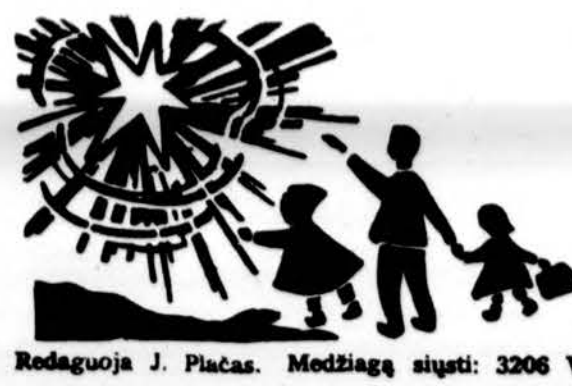
Redaguoja J. Placas. Medžiagą siūti: 3206 W. 65th Place, Chicago, IL 60629

x LEMONTE, PL centre , TRANSPAK įstaiga veikia kiekvieną savaitę: penkt. 3 v. p.p. - 7 v.v., šešt. 10 v.r. - 3 v. p.p., sekm. 8:30 v.r. - 2 v. p.p. Tel. 708-257-0497 arba 312-436-7772. (sk)