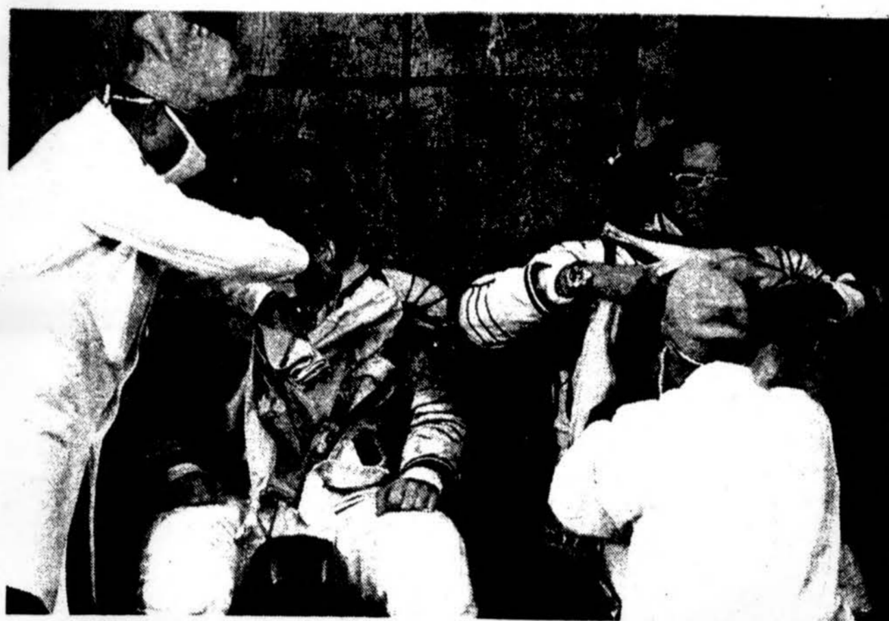
Antradienį, 11:11 val. ryto iš Rusijos erdvių centro Bainokur, Kazachstane, iškilo erdvėlaivis, kurio iguloje skrido ir vienas amerikietis astronautas - dr. Norman Thagart (dešinėje). Nuotraukoje astronautai rengiami skrydžiui. Kartu su Thagart iguloje buvo ir leit. pulk. Vladimir Dežurov bei skrydžio inžinierius Gennadij Strekalov. Ši misija truks 90 dienų. Po dviejų dienų erdvėje jų erdvėlaivio Sojuz kapsulė prisijungs prie Mir erdvių stoties, kurioje iki birželio mėnesio jie atliks mokslinius bei medicinos eksperimentus. Birželio mėnesį į Mir stotį atsikris JAV erdvėlaivis parsižveičti jų namo į žemę.

J. Školjč savo kalboje Seime priminė, kad Slovėnijos valstybė susikūrė tik šio amžiaus pradžioje ir pabrėžė, kad jos istorija nepalyginamai trumpesnė už ilgaamžę Lietuvos valstybės istoriją. „Tačiau mus ištiko bendra nelaimė - totalitarinių valstybių okupacija ir prispauda“, sakė jis. „Todel slovėnų tauta nuoširdžiai sveikino Lietuvos nepriklausomybės atstatymą paskelbimą 1990 metais“, kalbėjo J. Školjč, „o netrukus atsikūrusios Slovėnijos parlamentas pačioje pirmoje savo sesijoje pripažino visų trijų Baltijos valstybių nepri-