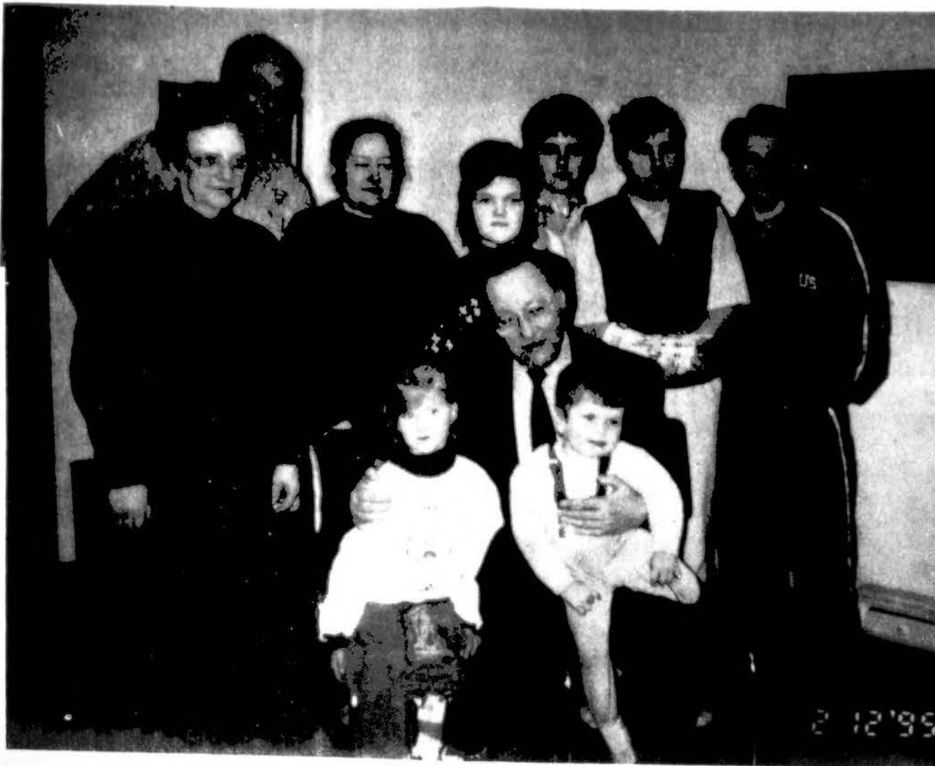
Vytautas Landsbergis su „Lietuvos Vaikų vilties“ globotiniiais Čikagoje.

Atsakymas: Medicare yra krašto — valstybės sveikatos draudimas, kuriuo gali pasinaudoti 65 metų ar vyresni asmenys. Juo gali pasinaudoti ir jaunesni kaip 65 metų, jei jie yra legaliai pripažinti nesveiki — nedarbingi, ir bet kokio amžiaus, jei serga inkstų liga. Medicare draudimas padeda apsimokėti susidariusias ligos sąskaitas, tačiau Medicare