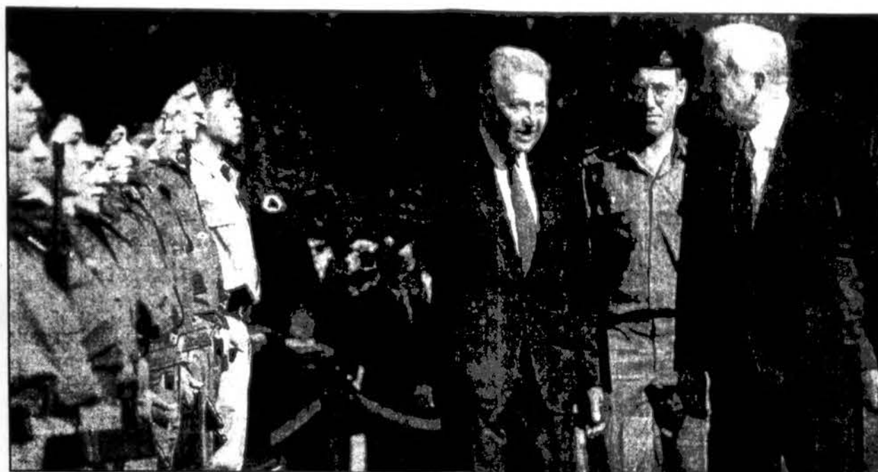
Vasario 28 d. Lietuvos prezidentui Algirdui Brazauskui atvykus į Izraelį, jį oficialiai sutiko Izraelio prezidentas Ezer Weizman (kairėje), vesdamas pro garbės rikiuotę. Brazauskas pabrėžė: „Lietuvos vyriausybė prisimena už (žydų) žudynių dalyvių teisinį persekiojimą“ ir žadėjo, kad šis darbas bus vykdomas „nuosekliai, sąžiningai ir viešai“.

JAV taip pat ketina skirti pinigų Estijos radiacinio saugumo specialistų rengimui bei Baltijos taikos palaikymo batalionui. JAV viceprezidentas Albert Gore Baltijos šalių vadovus pradžiugino tuo, kad Vašingtonas skirs 160 milijonų dolerių iš Baltijos šalių išvestų Rusijos armijos karininkų butų