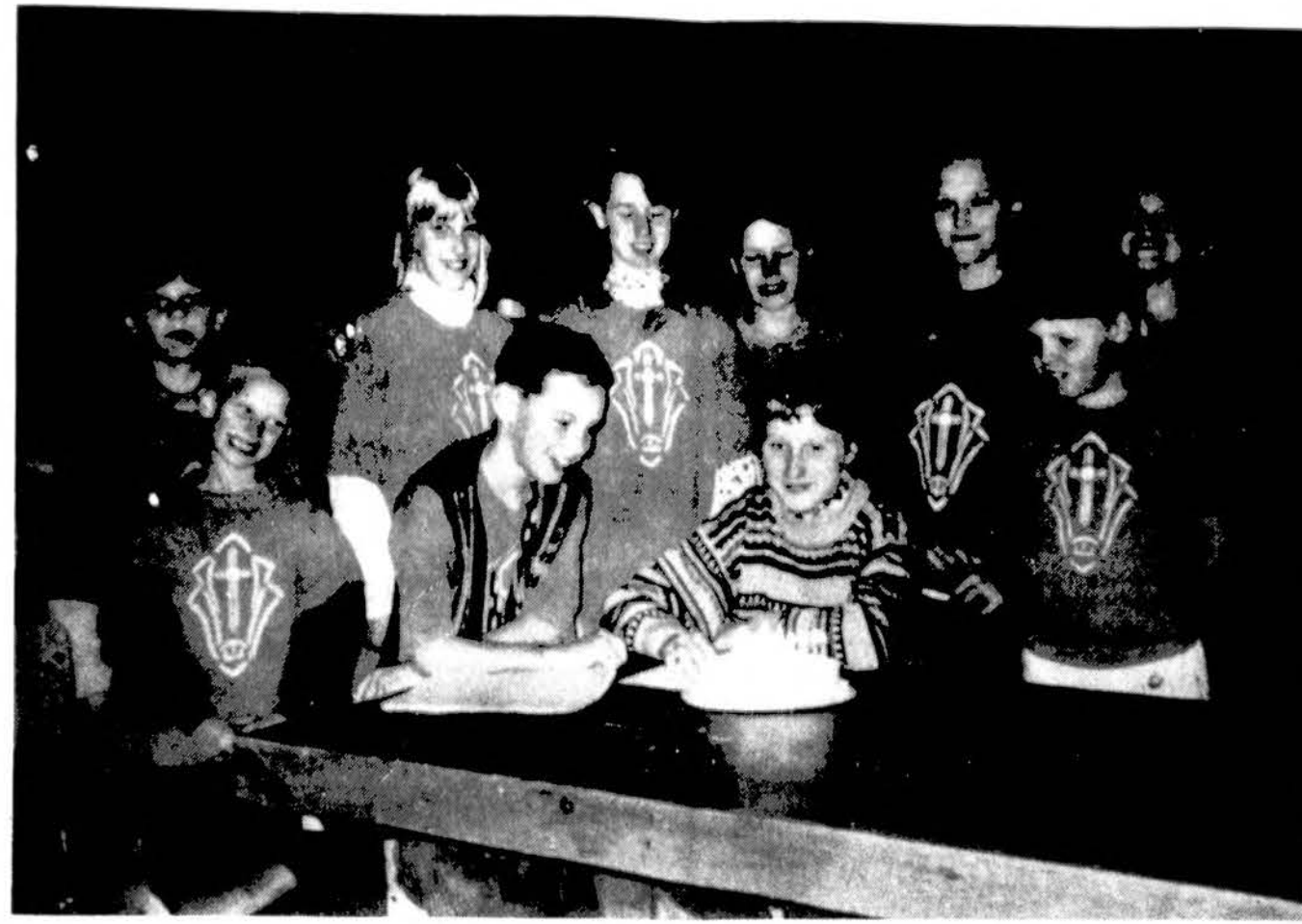
Hamiltono, Kanadoje, jaunučių susirinkime.