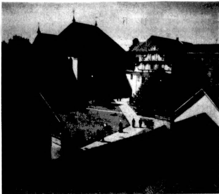
Kauno Tarpdiecizinės kunigų seminarijos kiemelis.

Proscar stabdo dihidrotestosterono gamybą ir mažina prostatą. Simptomai pagerėja tik po 6 mėnesių. Pagerėja apie 30% pacientų. Apie 2-3% nusiskundžia impotencija ir libido sumažėjimu. Vaistai Hytrin ir Minipress (vartojami dar ir padidintam kraujo spaudimui gydyti) atleidžia šlapimo pūslės kaktiuko ir prostatos lygiųjų raumenų spazmus. Juos imant, po mėnesio apie 50% pacientų pagerėja. Šiuos vaistus vartojant, yra patariama juos imti vakare prieš gulant. Tokiu būdu sumažėja jų pašalinio veikimo simptomai, pvz., svaigimas ir nuovargio jausmas. Gydoti vaistais, tiksliai nėra žinoma, kaip ilgai pagerėjimas tęsis. Nėra garantijos, kad ateityje nereikės operacijos. Bet tie, kurie tokius vaistus vartojo ir vėliau buvo operuoti turėjo mažiau komplikacijų ir jų gimimas buvo greitesnis. Yra manoma, kad 1995 metais prostatos operacijų sumažės 40%, o jų vietoje padidės imančių pacientų vaistus skaičius.