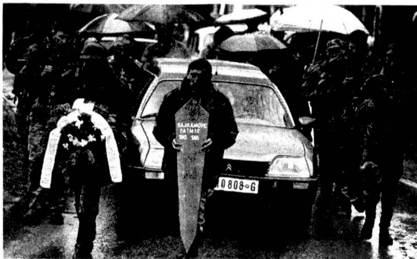
Bosnijos Tuzla mieste Bosnijos valstybinės kariuomenės karys neša antkapį serbų užmušto Bosnijos kareivio kapui. Jungtinių Tautų generalinis sekretorius Boutros Boutros-Ghali pasiūlymas, kad Jungtinių Tautų daliniai būtų suskirstyti į tris dalis — po vieną Bosnijai, Kroatijai ir Makedonijai, šiuo metu yra svarstomas Vakarų šalių kartu su Rusija paruoštoje rezoliucijoje, kurioje JT daliniai regione bus sumažinti nuo 12,000 iki 7,000.

Užsienio reikalų ginkluotės reikalinga pajėgoms modernizuoti ir stojimui į NATO pasirodinti. Tačiau neturi nukentėti ir vidaus gamyba, sakė ministras. Todėl pirkdama užsienio įrangą, Lenkija nori pati gaminti kuo daugiau jos komponentų. Tuo siekiama atnaujinti šalies gynybos pramonę.