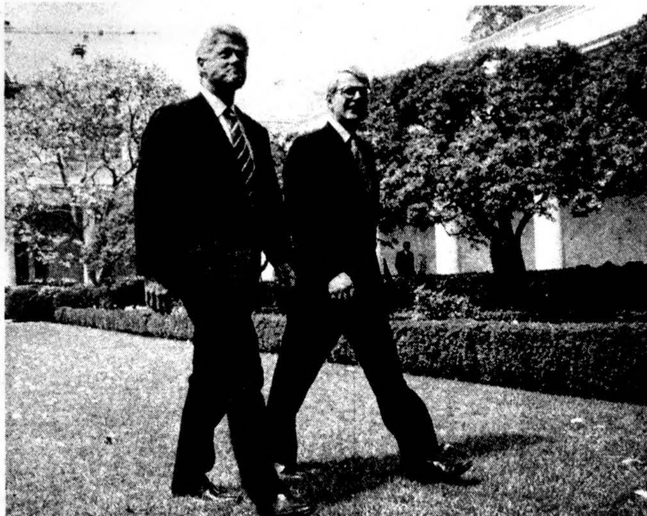
JAV prezidentas Bill Clinton ir Britanijos premjeras John Major vaikšto po Baltųjų rūmų Rožių sodą balandžio 4 d., kalbėdamiesi įvairiais klausimais, imtinai ir apie jų nesutarimą Airijos sukilėlių atžvilgiu. Santykiai tarp jų pablogėjo kovo mėnesį, kai Bill Clinton, nepaisydamas Britanijos premjero patarimo, Baltuosiuose rūmuose priėmė Airijos sukilėlių vadą ir leido jam telti lėšas Amerikoje, nors daugelis britų juos laiko teroristais. Nors iš tiesų šiuo klausimu jie išsiskiria, jie tvirtino žurnalistas, jog dauguma klausimų jie sutaria. Pavyzdžiais nurodė sutarimą sankcijų Irakui klausimą, kad Rusija neturėtų Irake statyti atominį elektrinį ir kad NATO turi būti plečiamas palaipsniui.

Nedidelės eilės buvo ir Vilkauskio muitinės Kalvarijų poste. Biržų muitinės Saločių poste vykti į Latviją laukė 8 lengvieji automobiliai ir 20 sunkvežimių.