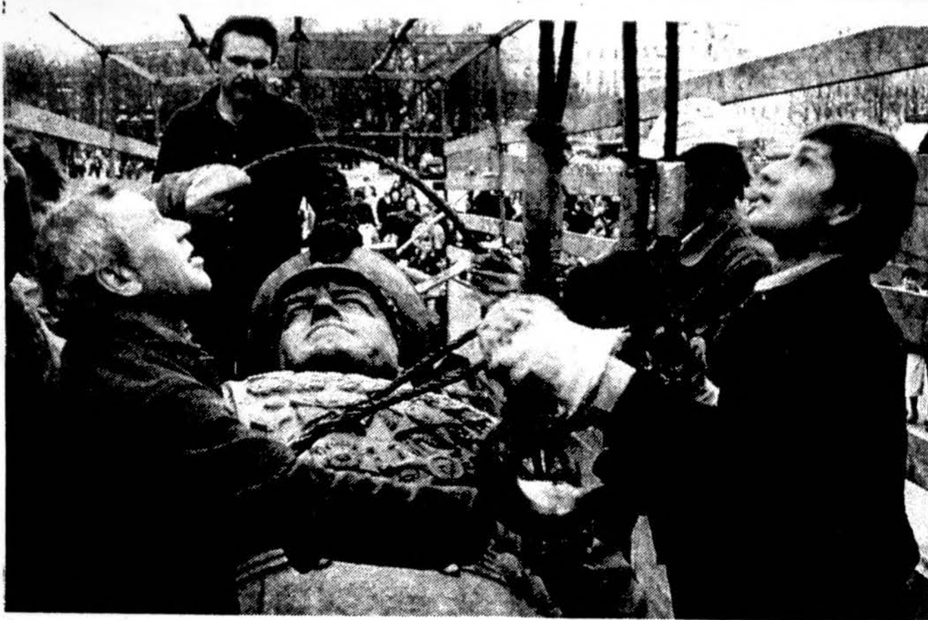
Antradienį Maskvoje darbuotojai iš sunkvežimio iškėlė maršalo Georgij Žukov statulą, atvežtą iš St. Peterburgo. G. Žukov, kuris vadovavo Stalingrado gynybai prieš vokiečius, ir Berlyno puolimui II Pasaulinio karo pabaigoje, statula bus pastatyta Maskvos miesto centre, minint Antro Pasaulinio karo pabaigos 50-ąsias metines.