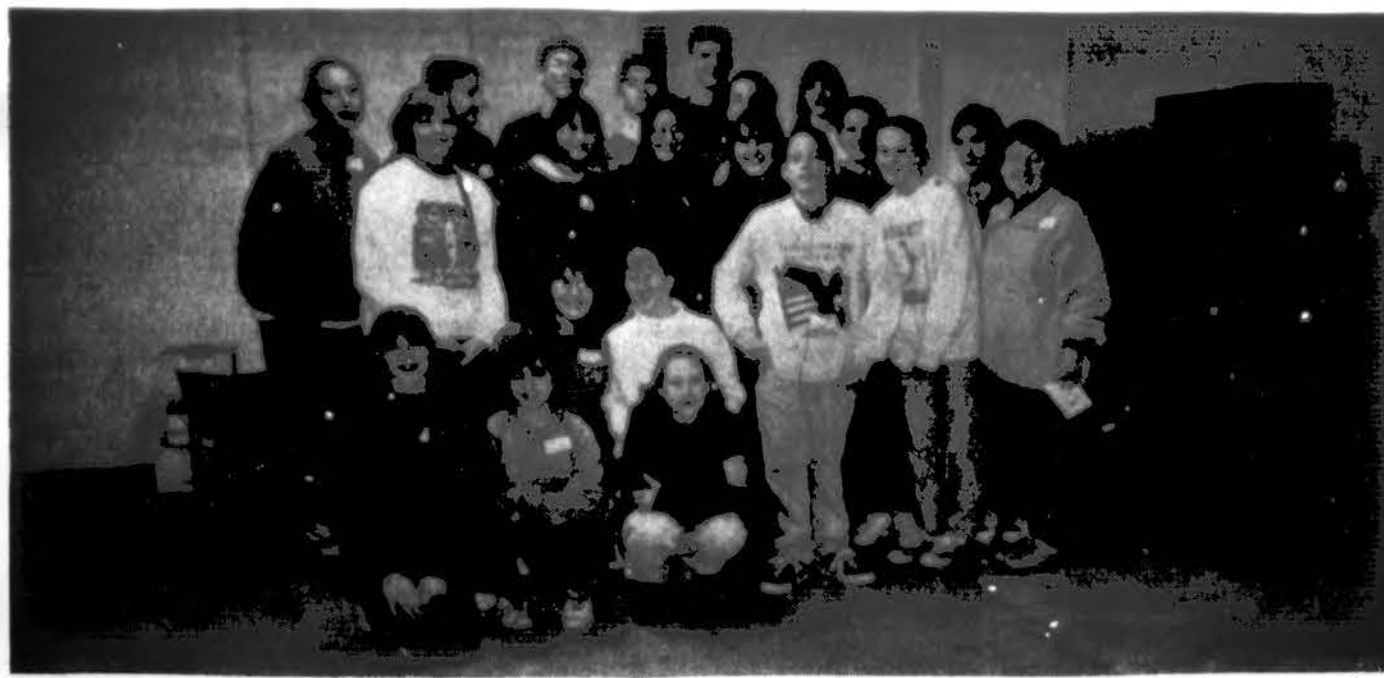
Detroito „Žiburio“ lituanistinės mokyklos mokiniai World Medical Relief centre talkinę vaistų siuntų paruošime.