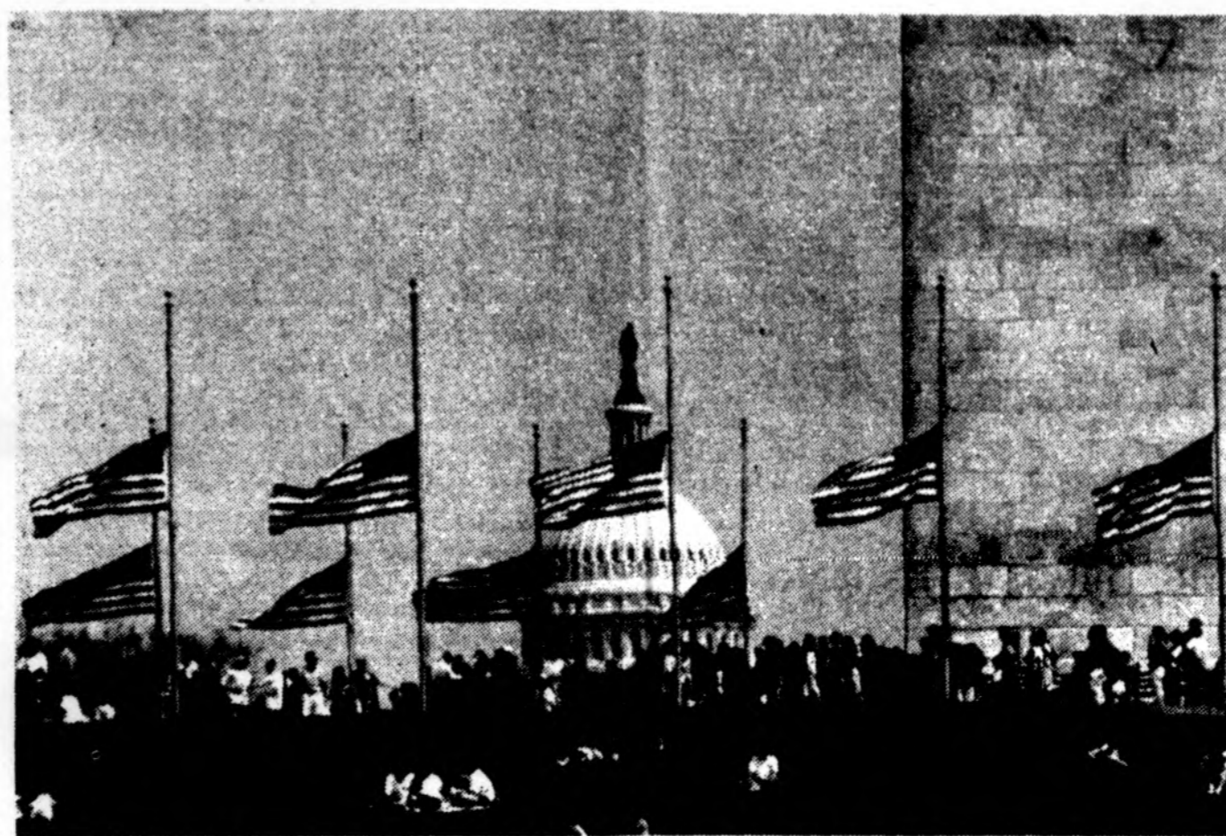
JAV prezidentas Bill Clinton ketvirtadienį įsakė, kad JAV vėliavos būtų iškėlimos pusę stiebo, reiškiant gerbimą ir pagarbą Oklahomo City sprogime žuvusiems žmonėms. Teroristinių sprogdimų prezidentas pavadino „bailumo veiksmu“. Atkasant griuvėsius randama vis daugiau žuvusiųjų. Penktadienio rytą jau rasta 56.