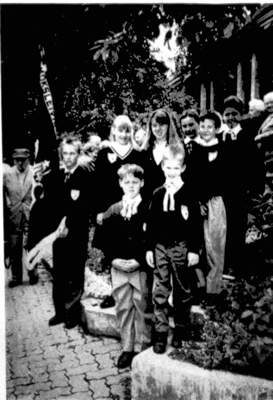
Montrealio jaunučiai ateitininkai pasiruošę iškilmėms.