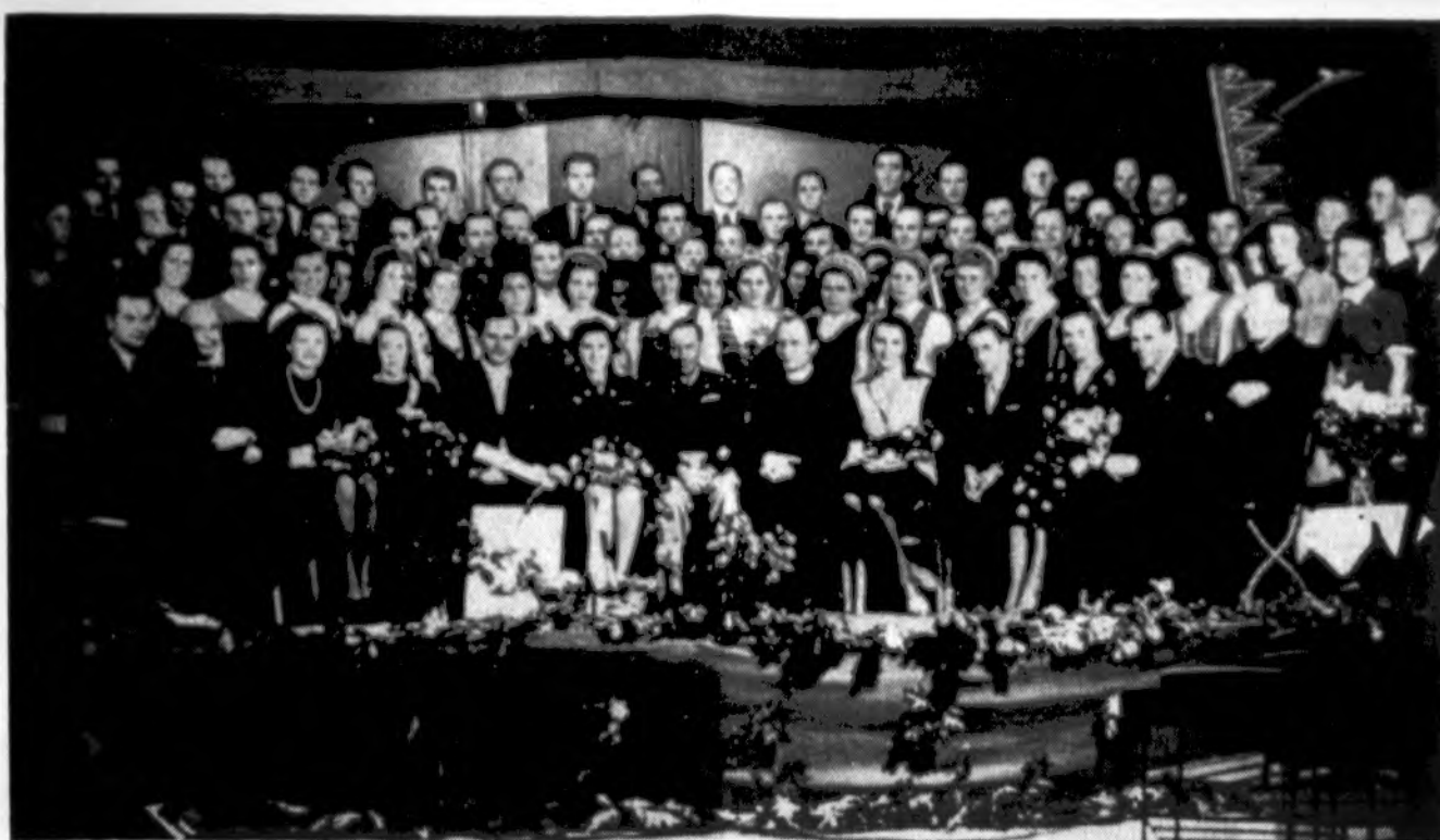
„Dainavos“ ansamblio krikštytos 1946 m. birželio 9 d. Hanau pabėgėlių stovykloje, Vokietijoje.

Jei mes artinsimės prie savo bendruomenės silpnųjų su tuo pačiu rūpesčiu ir meile, kaip Tomas lietė Kristaus žaizdas, išmoksime širdimi tarti: „Mano