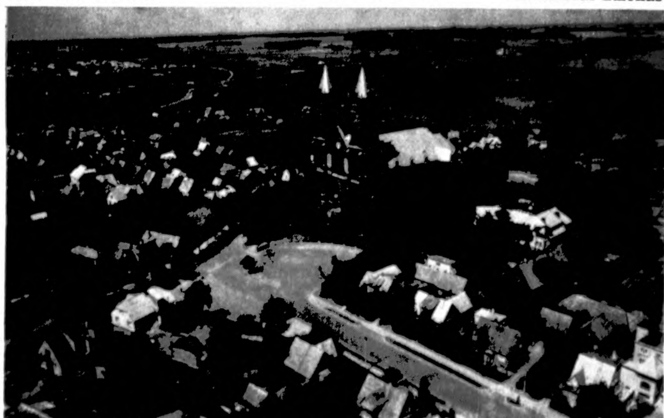
Kupiškis 1994 metais.

PETKUS & SON FUNERAL DIRECTORS MARQUETTE PARK 2533 W. 71 ST. CICERO 5940 W. 35 ST. PALOS HILLS 10201 S. ROBERTS ROAD LEMONT 12401 S. ARCHER AVE. (& DERBY RD.) EVERGREEN PARK 2929 W. 87 ST. TINLEY PARK 16600 S. OAK PARK AVE. ALL PHONES CHICAGO 1-312-476-2345 NATIONWIDE TOLL FREE (nemokamas) Tel. 1-800-994-7600