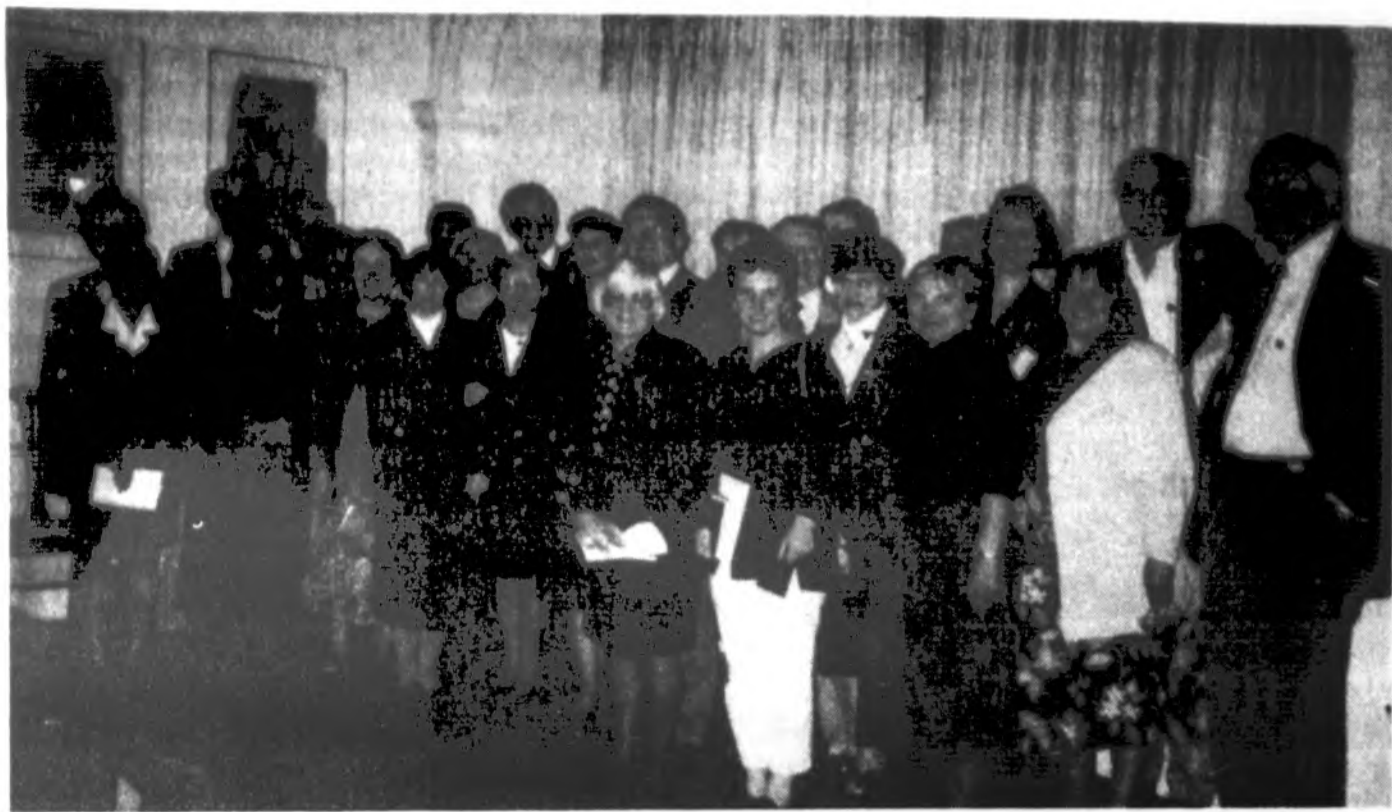
A.P.P.L.E. organizacijos dalyviai Lietuvos ambasadoje Vašingtone su amb. dr. A. Eidintu viduryje po diskusijų švietimo reikalais Lietuvoje.