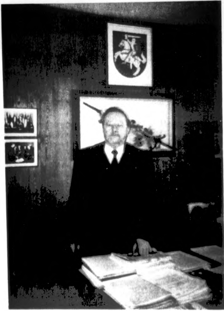
Prof. Vytautas Landsbergis savo darbo kabinete Vilniuje.

Švedijos ir Šveicarijos spauda pradėjo spausdinti savo užsienio korespondentų straipsnius, kuriuose jie išsamiai aprašė Dresdeną ištikusią katastrofą. Pasak jų, tai buvo teroristinio pobūdžio bombardavimas, kurio metu žuvo ir tūkstančiai karo pabėgėlių. Panašų pranešimą vasario 17 d. Amerikoje paskelbė ir Associated Press žinių agentūra, rezidencinės miesto dalies sunaikinimą pavadindama „deliberate terror-bombing“. Į tai tuojau pat reagavo Vyriausiasis sąjungininkų kariuomenės štabas (SHAEF) paskelbtu komunikatu, kuriame teigė, jog Dresdenas buvo bombarduojamas grynai strategiiniu tikslu, o jei tuomet miestas buvo pri-