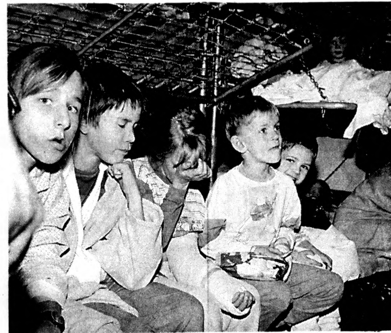
Kroatų vaikai slėpėsi nuo serbų bombų puolimo Zagrebo pagrindinės vaikų ligoninės rūsyje. Serbai jau antrą dieną raketomis bombarduoja Kroatijos sostinę, šįkart sužeidami 43 civilius ir vieną policininką, kuris žuvo, bandydamas išimtuoti prie ligoninės nukritusią bet nesprogusią bombą. Viena iš penkių raketų pramušė Draminių Menų Akademijos stogą, sužeisdamas ten repetuojančius rusus, ukrainiečius ir britus baletu šokėjus. Antrasis puolimas vyko tuo pačiu metu kai Jungtinių Tautų atstovas Jasuši Akaši paskelbė išsuderėjęs paliaubas ir sakė: „Turiu abiejų pusių garbės žodį, kad vykdys susitarimą“. Sutartis įsigaliojo trečiadienio vidudienį. Bet sutartyje nepameta, ar bus iš kroatų reikalaujama atiduoti praėjusį sekmadienį atsiimtą teritoriją.

Projekte dalyvauja ir JAV Kongreso Biblioteka, kuri parūpins reikiama įrangą ir inžinerinį personalą apmokyti. Baigus darbus, lietuvių ir žydų periodinių leidinių mikrofilmų kopijos bus perduotos Lietuvos Valstybinės Biblio-