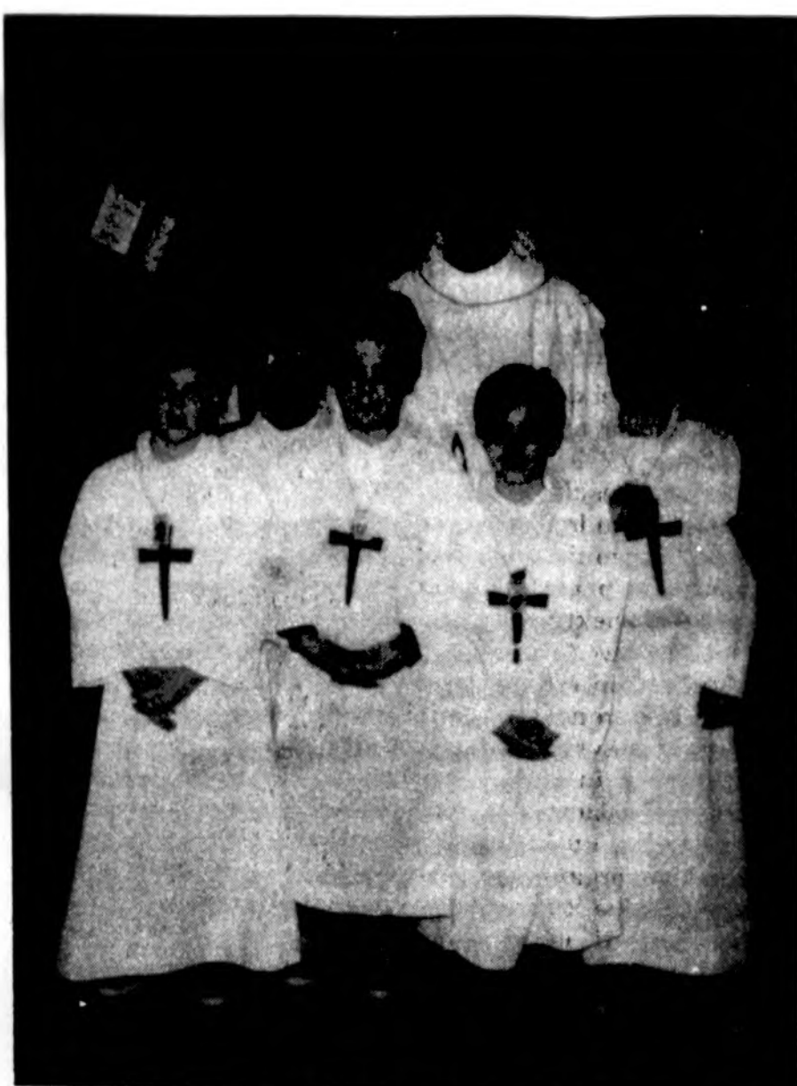
Kun. K. J. Ambrasas po šv. Mišių šv. Jono Bosko parapijoje Montrealyje kartu su patarnautojų pulkelio š. m. balandžio mėn.

Ant odos paviršiaus būna įvairių bakterijų, jų tarpe ir streptokokų. Būdami odos paviršiuje, jie žmogaus organizmui nekanksmingi, bet susižeidus ar