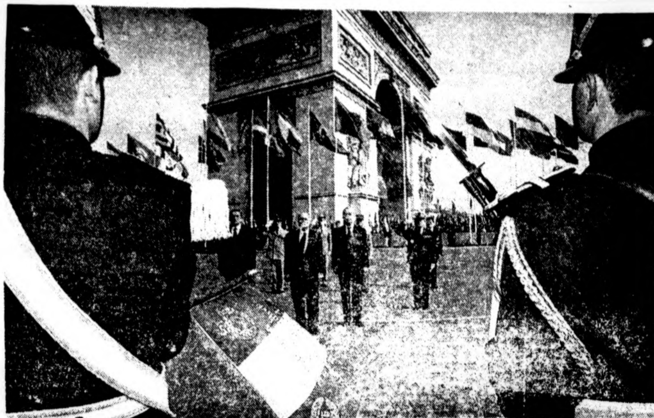
Pirmadienį Paryžiuje prie Triumfo arkos Prancūzijoje prezidentas Francois Mitterrand, ministras pirmininkas Edouard Balladur ir praėjusį sekmadienį išrinktas būsimasis prezidentas Jacques Chirac stebėjo 2,500 karių, nešančių sąjungininkų šalių vėliavas, iškilmėse minint Antrojo Pasaulinio karo 50 metų sukaktį.

Vilnius, gegužės 5 d. (Elta) - Pasibaigus vienašališkoms paliauboms, Rusijos ginkluotosios pajėgos naktį (gegužės 11-12 d.) pereis į puolimą, jei vyriausybė nesims jokių priemonių taikai pasiekti, pareiškė Rusijos gyny-