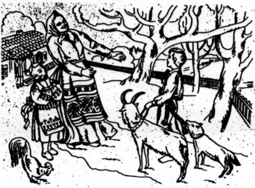
Lietuvos kaimo mama su vaikeliais. Piešė H. Naruševičiūtė-Žmuidzinienė