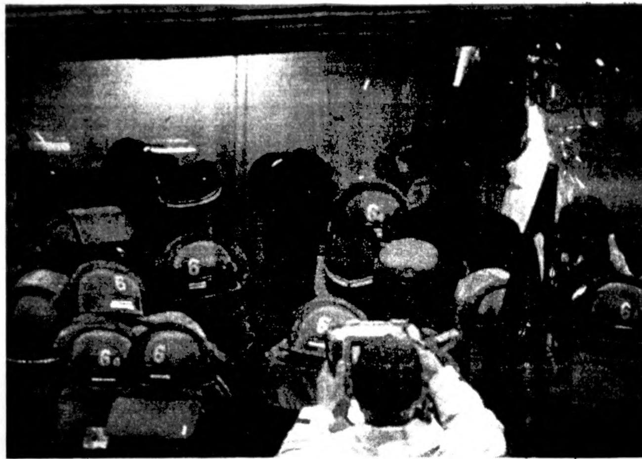
Japonijoje policija elektriniu pjūklų prapjauna duris slėptuvės, kur slėpėsi sektos Aum Šinrikio vadovas Šoko Asahara. Jį policija suėmė ir apkaltino žmonių nužudymu, kai jie žuvo kovo mėnesį nuo sektantų paleistų nuodingų dujų Tokijo požeminio traukinio stotyje. Vadas kaltinamas, nes jis raginęs sektantus dujomis naikinti „netikinius“ ir kadangi sektantų būstinėse rasta daugybė tonų medžiagų nuodingoms dujoms gaminti. Japonijos valdžia viliasi, kad suėmus vadą ir 40 šios sektos vadovų, pasibaigs ligšiol vykęs tolygus karas tarp sektantų ir Japonijos valdžios.

Už Lietuvos laisvę kovoje rezistentai buvo prisiminti ne