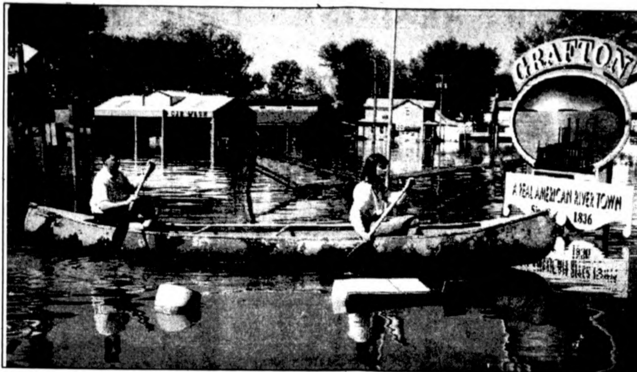
Mississippi upės slėnio miesteliai ir miestai vėl patvino — pirmą kartą po didžiųjų 1993 m. potvynių. Čia praėjusį penktadienį žmonės iriasi į savo butą Grafton, Ill., miestely. Nors potvyniai toli gražu nesiekia 1993 m. lygių, ir šimet jie įvyko dėl pernelyg daug iškritusio lietaus.