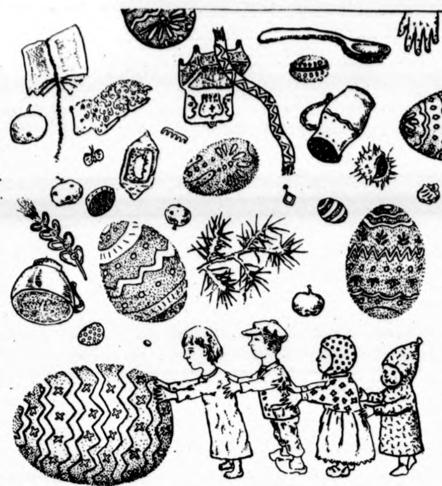
Lietuvių tautodailės kampelis pavasario temomis.

Isteigtas Lietuvių Mokytojų Sąjungos Chicago skyriaus