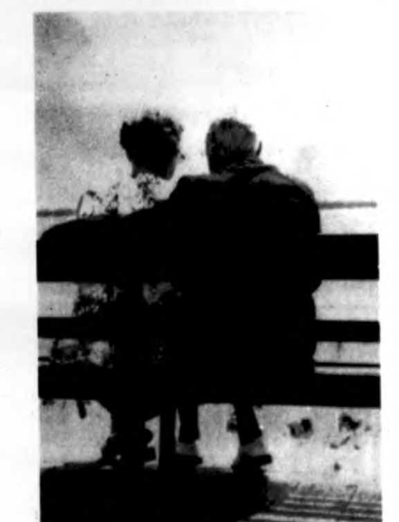
KAM MOKĖTI DVIEMS LAIDOJIMO ĮSTAIGOMS, JEI VIENAS TELEFONO SKAMBUS GALI VISKĄ SUTVARKYTI, NEŽIŪRINT NUOTOLIŲ?