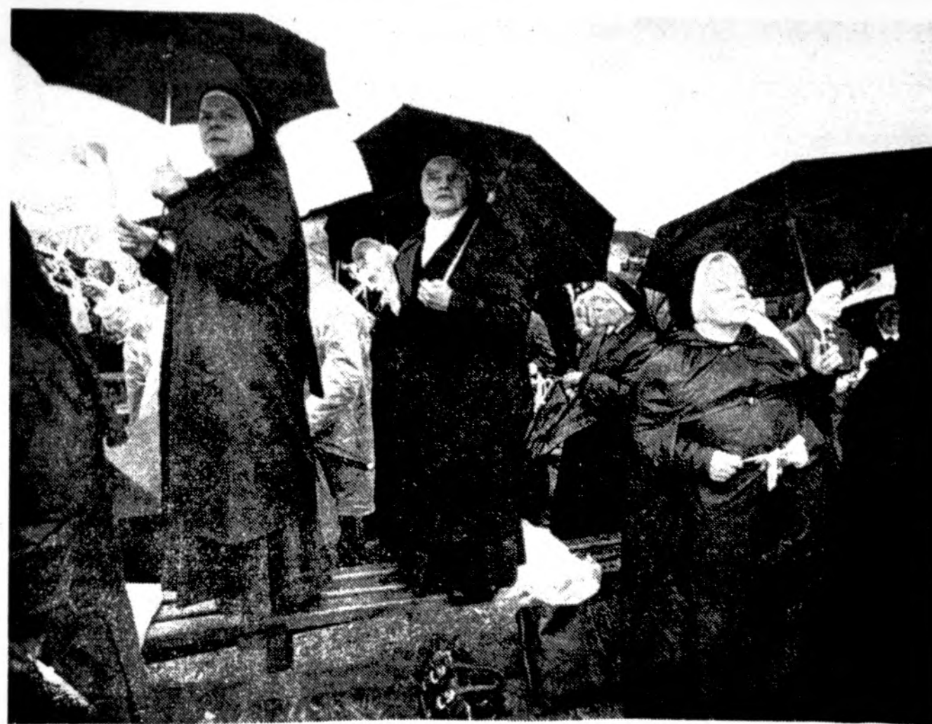
Čekijos Olomouc miesto aerodrome vienuolės lietuje laukia atvykstant popiežiaus Jono Pauliaus II. Jis ten sekmadienį laikė Mišias, minint tos srities 1620 m. kankinio kun. Jan Sarkander paskelbimą šventuoju. Mišių metu pasakyto pamokslu metu jis atsiprašė už katalikų padarytas skriaudas protestantams ir kitų religijų tikintiesiems.

Duodamas paliudymus JAV Senate praėjusią savaitę Warren Christopher svarstomus biudžeto mažinimus pavadino neatsakingais ir sakė, kad jei jie būtų įvykdyti, tektų uždaryti daug ambasadų, prarandant da-