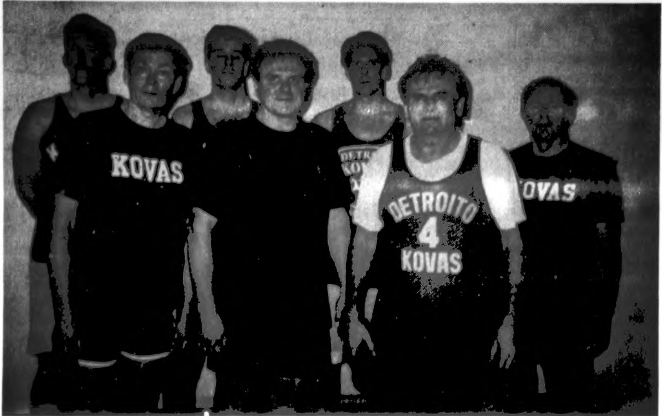
Detroito „Kovo“ žaidėjai, dalyvavę ŠALFAS s-gos senjorų krepšinio pirmenybėse š.m. balandžio 1-2 d. vykusiose Detroito.