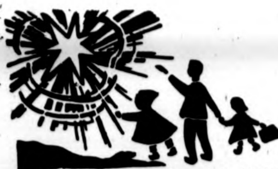
Redaguoja J. Plačas. Medžiagą siūsti: 3206 W. 65th Place, Chicago, IL 60629

x Siuntiniai į Lietuvą laivu per TRANSPAК. Skubiems siuntiniams – AIR CARGO. Maisto siuntiniai nuo $29 iki $98. Produktai aukštos kokybės. Du populiariausi tai $39 šventinis siuntinys ir 55 sv. įvairaus maisto už $98. TRANSPAК, 2638 W. 69 St., Chicago, IL 60629, tel. 312-436-7772.