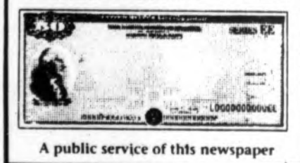
A public service of this newspaper