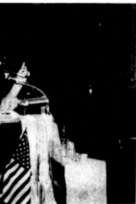
Valdas Adamkus, JAV Aplinkos apsaugos agentūrai atstovaujantis, konferencijoje vyksiančioje birželio 11-15 d. Pietų Korėjoje, Seoul mieste, atstovaus JAV Aplinkos apsaugos agentūrai. Birželio 14 d. plenumo posėdyje Valdas Adamkus kalbės apie per 25 metus JAV duotą ekologinį inaišą globaliniame gamtos apsaugos darbe. Konferenciją globoja Amerikos ambasada Korėjoje.

x Nevirkime pietų , bet atvykime į smagią gegužinę, kurią Ateitininkų Federacijos fondas rengia sekmadienį, birželio 18 d. Ateitininkų namuose, 12690 Archer Ave., Lemont, IL. Pradžią 12 val. (sk.)