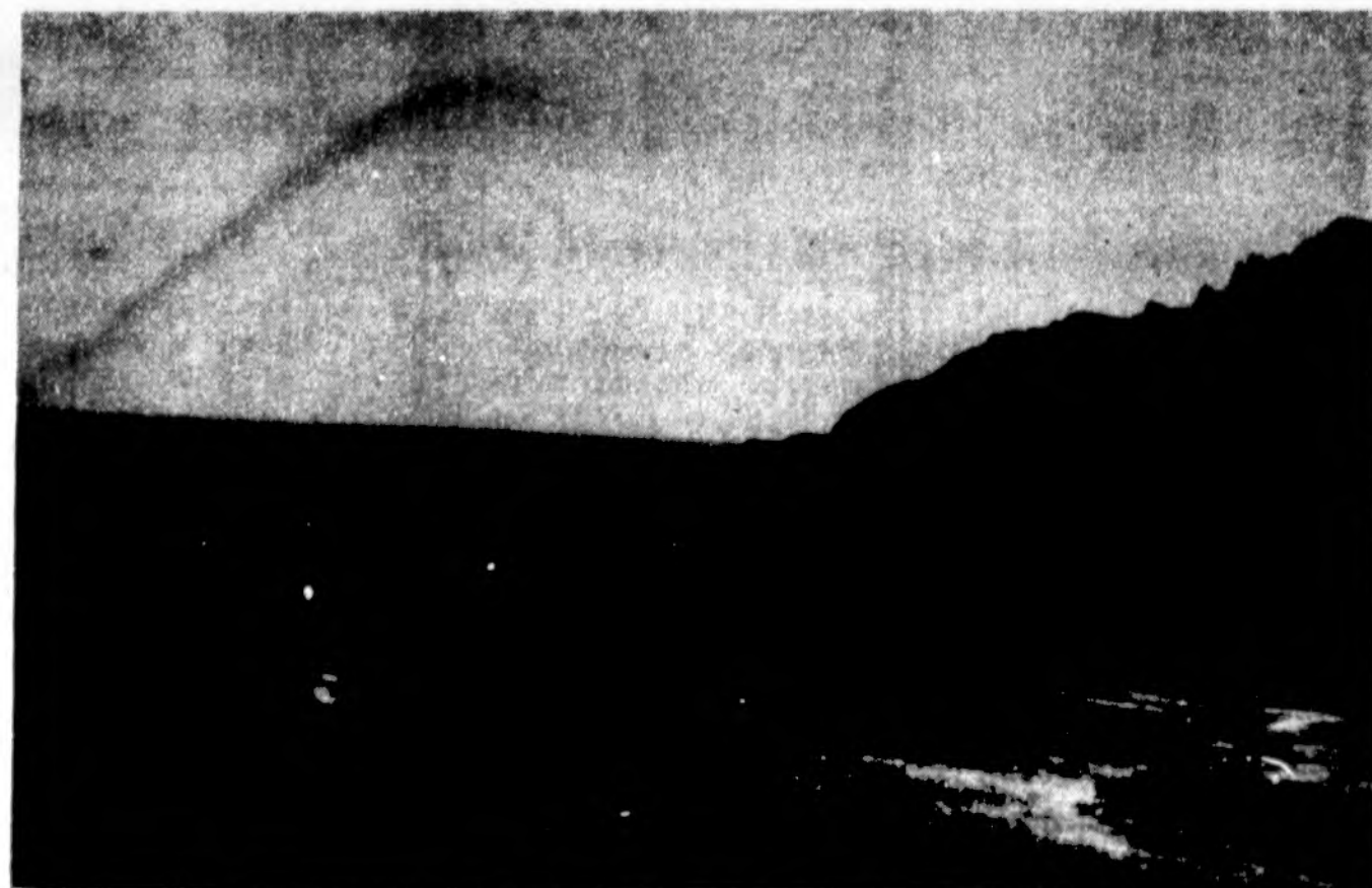
Taip atrodė piečiausia Pietų Amerikos vietovė — Cape Horn, 1995 m. sausio 18 d.

gomis, tačiau daugiausiai teko šlapti ir šalti Linui. Tuo metu, trumpomis poilsio minutėmis fotografavomės, filmavomės Cape Horn paunksmėje. Prancūzų buriuotojai buvo sakę, kad galima išlipti Cape Horn saloje,