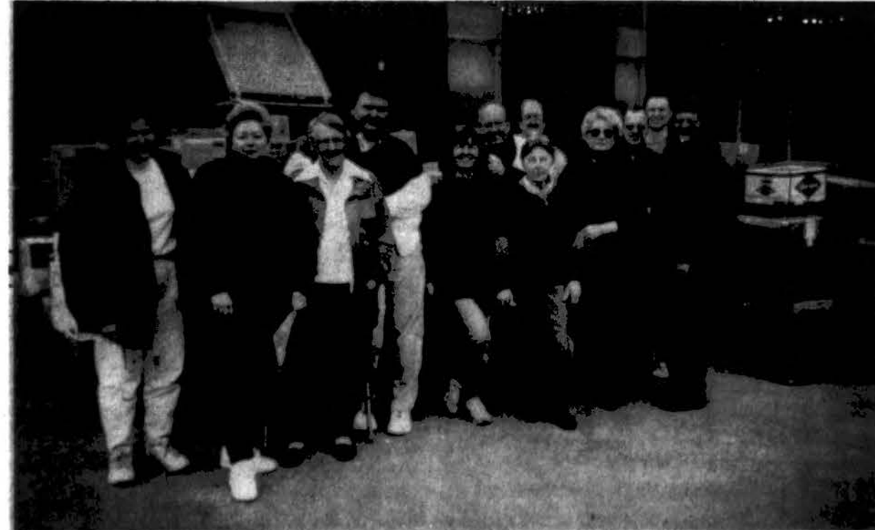
Balandžio mėnesį vėl beveik 300 „Saulutės“ siuntinių iškeliavo į Lietuvą. Čia talkininkų būrelis, padėjęs tuos siuntinius išsiųsti.

• Siuntiniai į Lietuvą laivu per TRANSPAK . Skubiems siuntiniams – AIR CARGO. Maisto siuntiniai nuo $29 iki $98. Produktai aukštos kokybės. Du populiariausi tai $39 švintinis siuntinys ir 55 sv. įvairaus maisto už $98. TRANSPAK, 2638 W. 69 St., Chicago, IL 60629, tel. 312-436-7772. (sk)