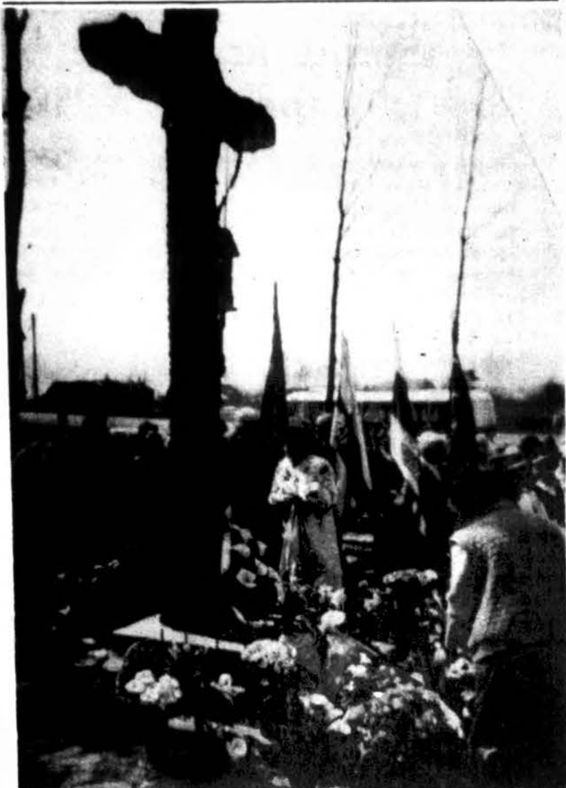
Krosnoje pastatyto žuvusiems Lietuvos partizanams paminklo pašventinimo iškilnių vaizdas.