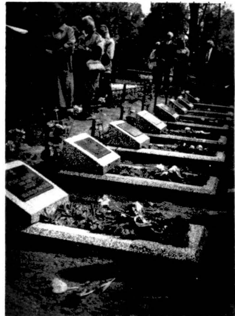
Pokario metų partizanų kapai Digrių kapinaitėse.

Tolimame Lietuvos kaime gyvena viena tokia „principin-gųjų“ šeima. Aš jų asmeniškai nepažįstu. Jokių reikalų niekada neturėjau. O jie mane, de-ja, pažįsta! Turbūt kaip nulup-tą. Nes net matyti — apsaugok, Dieve, (jiems tiktų; tėve Staline)