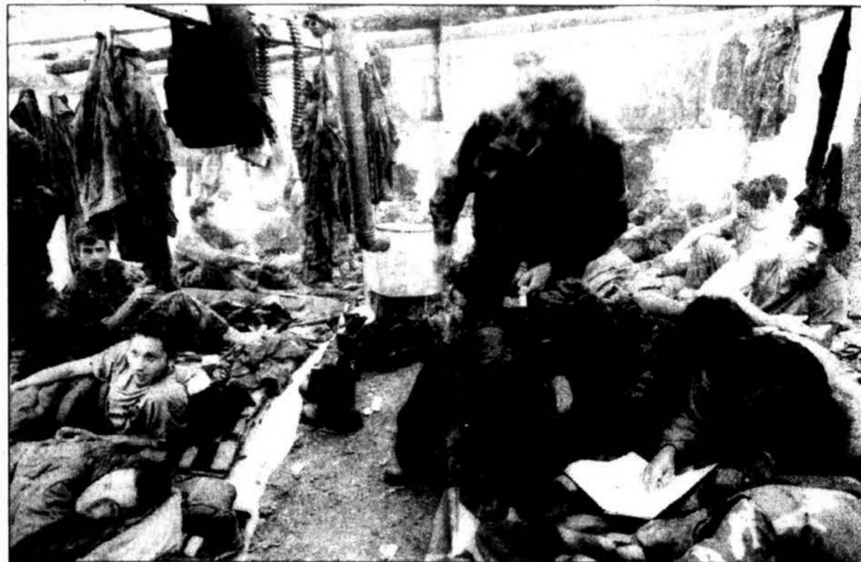
Bosnijos vyriausybės kariai palapinėje ant Treskavica kalno, į pietvakarius nuo Sarajevo, kur jie pirmadienį atkovojo nuo serbų. Bosnijos vyriausybės karinės pajėgos - tarp 20,000 ir 30,000 karių - renkasi Sarajevo apylinkėse, ruošdamiesi galutiniam vadavimui mūšiu, nes įsitikino, kad pagalbos iš Vakarų neuolaus. Antradienio popietę Bosnijos serbai paleido dar 28 iš jų įkaitais laikomų Jungtinių Tautų taikos palaikytojų. Prieš tai jie jau buvo paleidę 230 įkaitų iš paimtų virš 320. Tad dabar serbai dar turi 52 įkaitus ir 92 JT kariai yra apsupti keturiuose JT postuose prie Sarajevo. Serbai planuoja paleisti visus, išskyrus 15, kad turėtų kuo derėtis. Sakoma, kad už tai Serbijos prezidentas Slobodan Milošević gavo NATO užtikrinimą, kad serbų pozicijos nebus bombarduojamos.

Valdininkų nurodymų kuriuos ypač išryškėjo, kai sovietų kareiviai paliko pasienio bazes (jų Kuršių nerijoje buvo aštuonios). „Iš centro“ buvo pasakyta, kad reikia nugriauti ir ką jose įkurdinti. Tačiau naujai išrink-