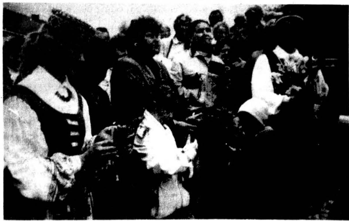
Kauno Santakoje pagerbiant už Lietuvos laisvę ir nepriklausomybę žuvusius partizanus.

ieškoti ne tik universiteto bibliotekoje, bet ir daugelyje kitų šalies bei pasaulio bibliotekų. („Universitetas Vytauti Magni“, 1995 m. gegužė)