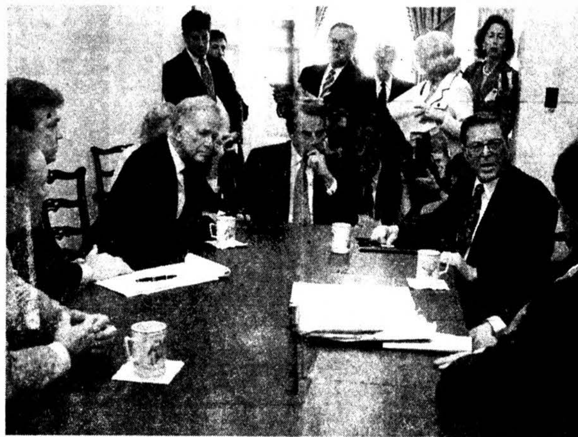
Visi nustebo, kai trečiadienį JAV Kongreso respublikonai vadai susirinko į posėdį svarstyti prezidento Bill Clinton pasiūlytą JAV biudžeto projektą. Jie sakė, kad patraukliausias jo elementas jie įjungė į savo projektą. Nors daugelis demokratų kritikavo prezidentą už tai, kad ir jo projekte mažinamos lešos skiriamos sveikatos priežiūros Medicaid ir Medicare programoms, prezidento plane šioms programoms skiriama gerokai daugiau lešų. Prezidento plane taip pat skiriama daugiau lešų švietimui. Be to, kai respublikonų plane numatomi mokesčių sumažinimai visiems mokesčių mokėtojams, prezidento plane turtingiausieji turės mokėti daugiau mokesčių.

Kazys Škirpa buvo Lietuvos aktyvistų fronto įkūrėjas, 1941 m. sukilimo organizatorius ir rengėjas, laikinosios Lietuvos vyriausybės vadovas. Diplomas 1937 m. atstovavo Lietuvai