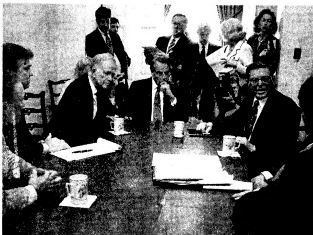
Visi nustebo, kai trečiadienį JAV Kongreso respublikonai vadai susirinko į posėdį svarstyti prezidento Bill Clinton pasiūlytą JAV biudžeto projektą. Jie sakė, kad patraukliausias jo elementas jė į jungs į savo projektą. Nors daugelis demokratų kritikavo prezidentą už tai, kad ir jo projekte mažinamos lėšos skiriamos sveikatos priežiūros Medicaid ir Medicare programoms, prezidento plane šioms programoms skiriama gerokai daugiau lėšų. Prezidento plane taip pat skiriama daugiau lėšų švietimui. Be to, kai respublikonų plane numatomi mokesčių sumažinimai visiems mokesčių mokėtojams, prezidento plane turtingiausiai turės mokėti daugiau mokesčių.

Tautų Sąjungoje, Genevoje, 1938 m. buvo nepaprastuoju pasiuntiniu ir įgaliojimų ministru Varšuvoje, po to dirbo diplomatu Vokietijoje iki pat Lietuvos atstovybės uždarymo.