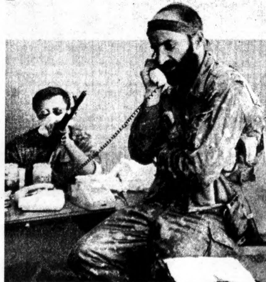
Čečėnų vadovas Šamil Basajev, telefonu kalbasi su Rusijos ministru pirmininku Viktor Černomyrdin, stengdamasis išsiderėti sąlygas ne tik čečėnams sugrįžti, bet ir Čečėnijai vesti tikras derybas su Rusija. Tuo tarpu jo strategija veikia. Čečėnai su 150 įkaitų Rusijos parlamento nariais bei žurnalistais yra pakeliami į Čečėniją, Grozne vyksta derybos tarp čečėnų vadovybės ir Rusijos — tuo tarpu tik dėl paliaubų sąlygų.

Nuo 1923 m., kai Klaipėdos kraštas buvo prijungtas prie Lietuvos, iki 1939 m. hitlerinės okupacijos, Macikuose buvo apsisostę Lietuvos kariuomenės 7-asis pėstininkų pulkas. 1940 m. čia vokiečiai įkūrė koncentracijos stovyklą. 1944–1954 metais čia buvo kalinami sovietų valdžiai nepaklūsę žmonės.