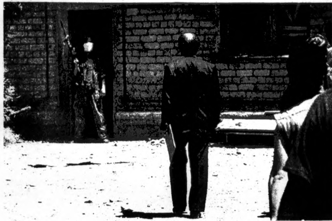
Rusijos televizijoje praėjusį savaitgalį buvo matomos ir tokios scenos, kai prie Budennovsk miesto ligoninės Rusijos parlamento narys bando derėtis su ginkluotu čečėnu, saugančiu ligoninėje vienu metu laikomus apie 2,000 įkaitų. Pirmadienį, čečėnams išvažiuojant iš miesto su 150 „savanorių“ įkaitų, sunkiai sergantys žmonės iš ligoninės buvo išvežti į kitas klinikas, vaikščioti galintys sužeistieji paleisti miesto aikštėje susirasti saviškius ir kelią namo.

Vienas 23-metis rusas, kurio du jauni broliai buvo užmušti, čečėnams užimant miestą, sakė: „Aš niekad nemačiau tokių baisių, bet mūsų valdžia čečėnams duoda ko tik jie reikalauja. Mūsų valdžia yra baisi ir nebijau to pasakyti. Jie visai