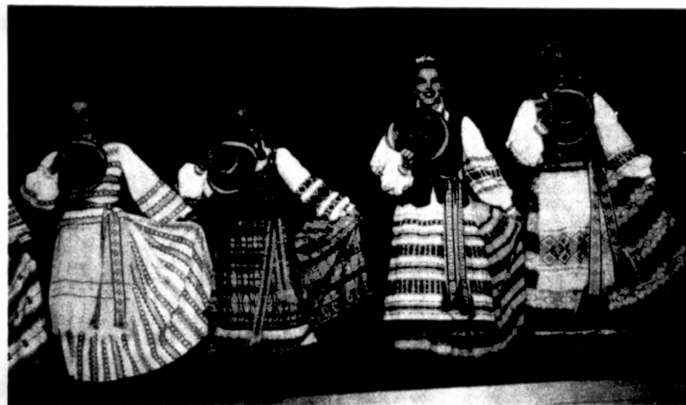
Hamiltono „Gyvataro“ šokėjos Clevelando scenoje.