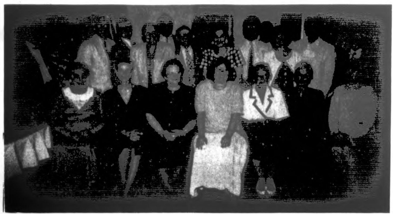
Spaudos, radijo laidų, JAV LB ir Lietuvių fondo atstovai LF ruoštoje spaudos konferencijoje š. m. birželio 13 d., „Seklyčioje“.