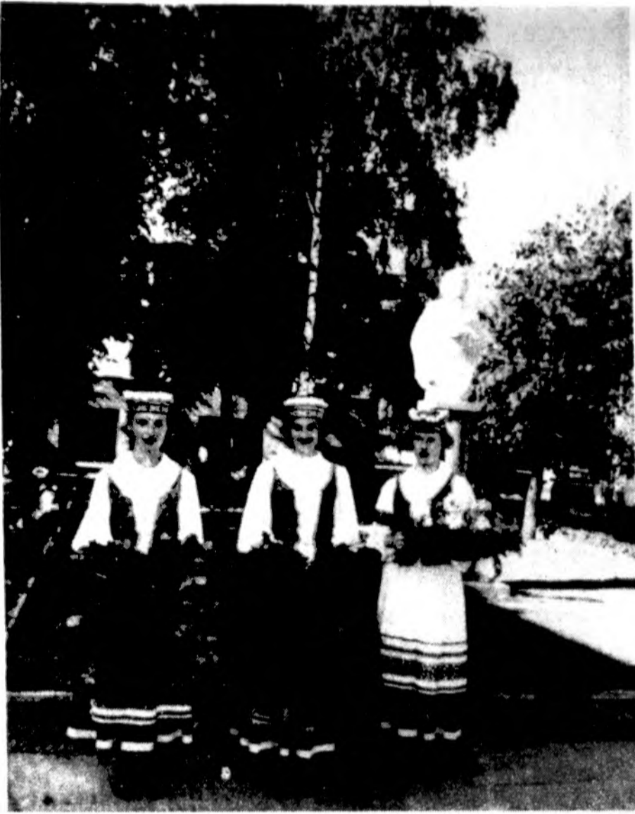
Paminklo L. Stuokai-Gucevičiui atidarymo proga 1994 m. Kupiškėje.

Už dovanojamą turta tokie mokesčiai: vaikams, tėvams – 1.5%; vaikaičiams, broliams, seserims – 3%, kitiems asmenims – 12.5%. Jei paveldimo ar dovanojamo turto vertė viršija pusės milijono litų suma, mokestis visiems asmenims dvigubėja. Mokesčius moka asmuo, kuris paveldi ar gauna dovaną turta. Įstatymas įsigalioja nuo