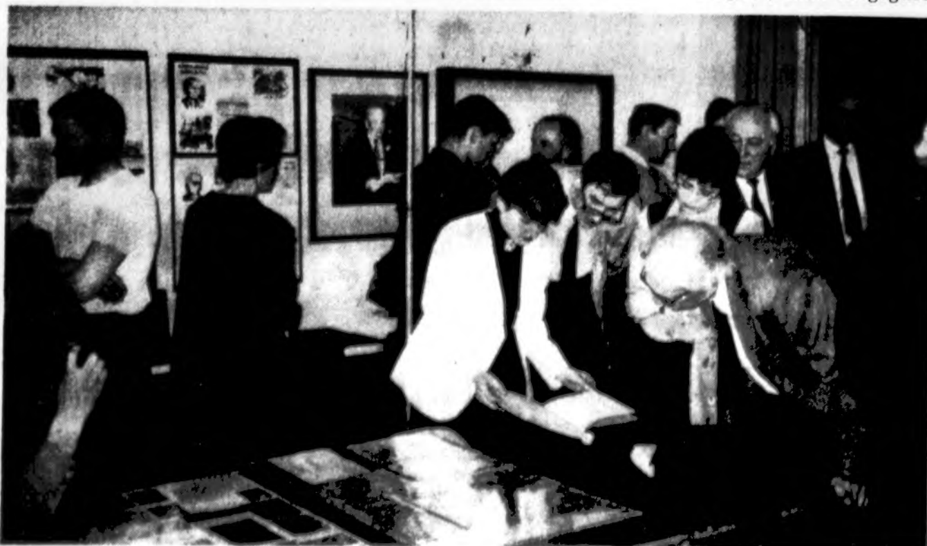
Studentai, fakultetas ir svečiai apžiūri išeivijos veiklos parodą Vytauto Didžiojo universitete Išeivijos centro atidarymo (1995.04.27) proga.

Bendrai, lietuvių daro gerai susižaidžiusio vieneto išpūdį. Prieš graikus jie ir klaidų mažiau darė. Kurtinaitis ypač pasitaisė. Tikimės, kad prieš jugoslavus jie taip pat gerai žais ir atneš dar vieną laimėjimą.