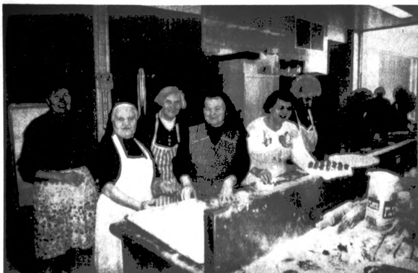
Pasaulio lietuvių centro darbščiosios šeiminiųkės...