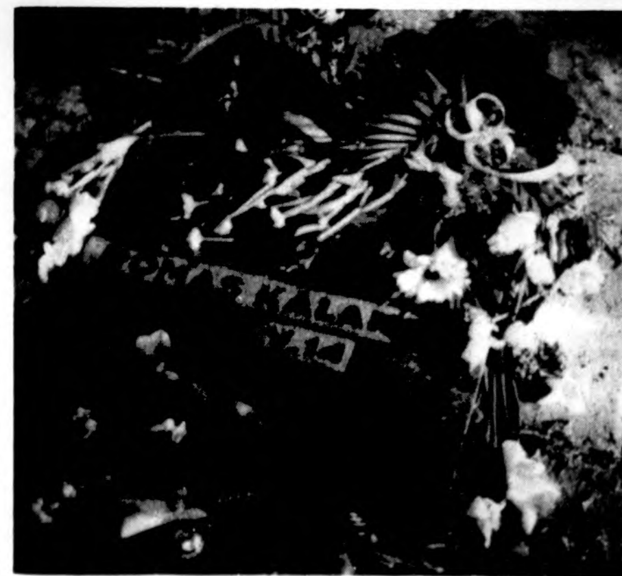
Romo Kalantos susideginimo vietoje Kaune 1995 m. gegužės 14 d. paminklinė lenta, papuošta gėlėmis.