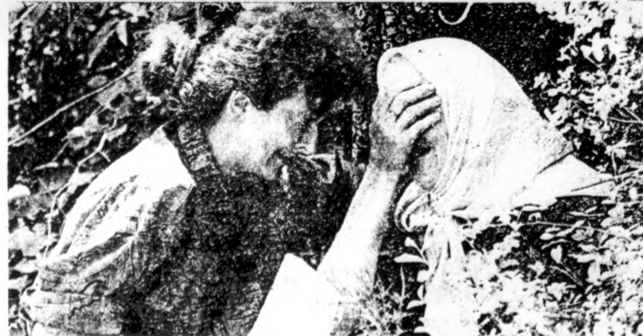
Bosnijos pabėgėlių stovykloje ketvirtadienį susitiko mama ir duklė, tačiau jos nežino visų kitų savo šeimos narių likimo. Bosnijos Tuzla aerodrome, esančiame 60 mylių nuo Sarajevio miesto, yra apie 5,000 tokių pabėgėlių.