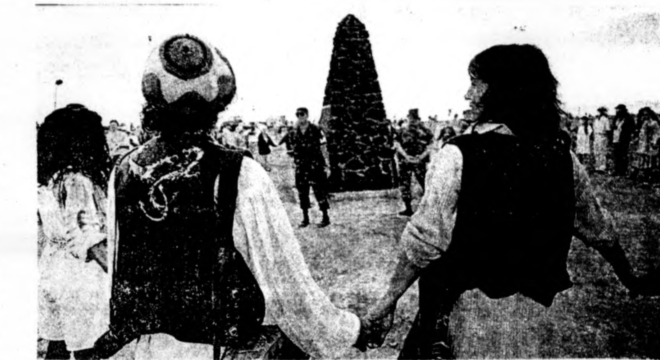
Antibranduolinės demonstracijos dalyviai sekmadienį „gyva“ juosta apsupto obeliską, žymintį Trejybę, esantį White Sands Missile Range vietoje New Mexico, kur prieš 50 metų buvo susprogdinta pirmoji atominė bomba.

Pirmąjį pusmetį Lietuvos žmonės ypač blogai atsiliėpė apie visas svarbiausias šalies valdžios institucijas, rašo dienraštis „Respublika“, paskelbęs pusės metų sociologinių tyrimų rezultatus. Anot laikraščio, pasitikėjimas jomis tolygiai mažėjo praėjusiais metais ir šiemet pasiekė stabilią, tačiau kritinę ribą: pasitikinčiųjų vyriausybei, prezidentūrai, Seimu, policija, teismams, savivaldybėms skaičius buvo ne didesnis nei 30 proc. Tuo tarpu nepasitikinčiųjų šių institucijų veikla visais mėnesiais buvo