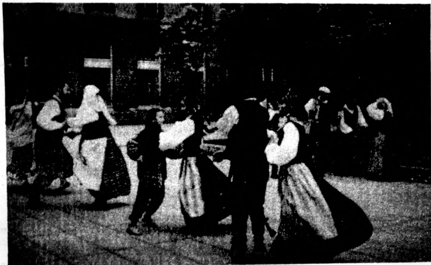
Tautinio ansamblio šokėjai Kaune, Laisvės alėjoje, šventės „Šoki trypk! — 95“ renginio metu.

Gyvendami dideliuose miestuose, kiekvienam nepažįstamame esame linke veikiau matyti pavojingą priešą, negu aukštą pagal krikščioniškąją sąvoką. O vis dėlto — norime ar nenorime — turime būti atsakingi vieni už kitus, ypač labiau už savo tautiečius. Jų daug senų, ligotų, vienišų lietuvių kiekviename mieste, kiekvienoje apylinkėje. Kai kuriuos galbūt net iš matymo pažįstame: sutikome bažnyčioje, renginiuose, gatvėje, kepykloje... Jie laikosi atokiai nuo kitų, mes jų artumas taip pat neieškome, nes nepatogu brautis į žmogaus gyvenimą. Tačiau ypatingais atvejais — o šie pavojingai karščiai jau į tokia kategoriją įeina — tikrai turėtume jausti pareigą „užmesti akį“ ir į tuos pavienius žmones, kad jie netaptų karščio mirties statistikos duomenimis. Nežiūrėkime asmeniškumų, bet žmoniškumo.