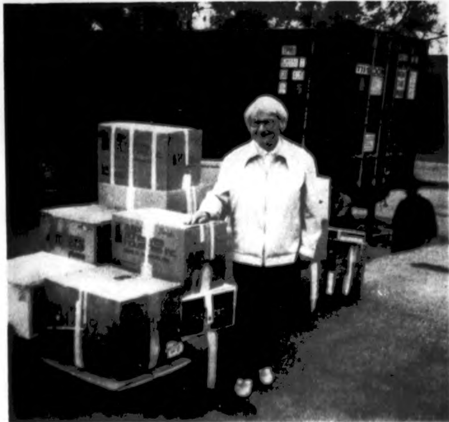
Telšių SOS vaikai darbuotoja pasiima Brighton Parko Lietuvių Bendruomenės apylinkės skirtą siuntą, persiuntą Lithuanian Mercy Lift.