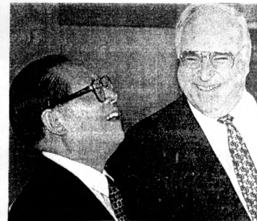
Kinijos prezidentas Jiang Zemin (kairėje) ir Vokietijos kancleris Helmut Kohl patenkinti susitikimo rezultatais.

Partneriai Kinijoje kasmet nori pagaminti 60,000 prabangių limuzinų bei 100,000 variklių. Dar susitarimo pasirašymo išvakarėse „Mercedes-Benz AG“ su „Yangzhou Motor Coach Man.“ pasiekė susitarimą dėl 7,000 kelioninių autobusų bei 5,000 važiuoklių automobiliams per metus gamybos.