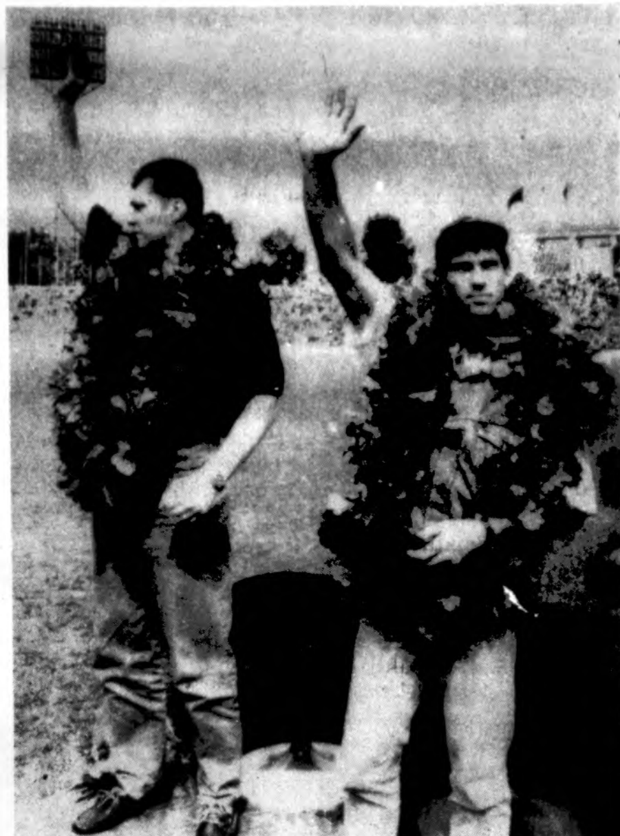
Arvydas Sabonis ir Šarūnas Marčiulionis, geriausieji Europos krepšinio pirmenybių žaidėjai Atėnuose, Vilniuje buvo sutikti kaip herojai. Jie ir kiti Lietuvos krepšinio rinktinės žaidėjai buvo papuošti ažuolo lapu vainikais.