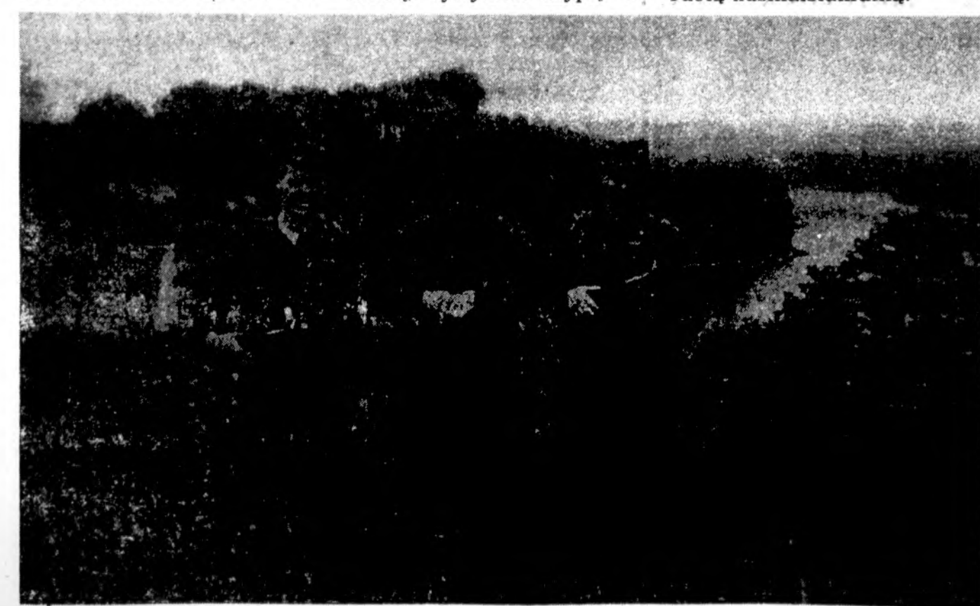
SKATo kariams atliekant mokomąjį Džukijoje, š.m. birželio mėn. žvalgai ant Liškiavos piliakalnio.

Moterų suvažiavimo išvakarėse šv. Tėvas tarytum stengiasi bent iš dalies atitaisyti istorijos skriaudas moteriškai giminei. O tai jau „susitaikymo pradžia“.