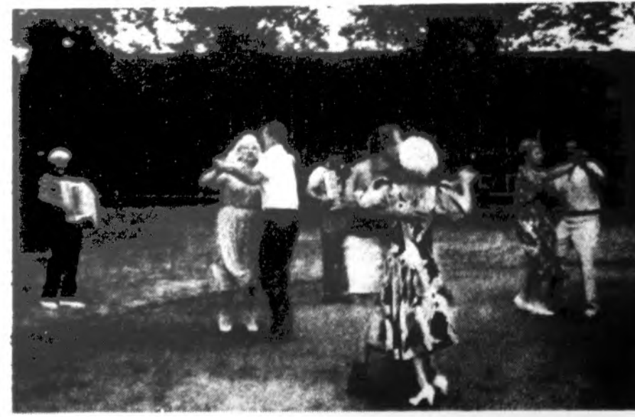
Pasaulio lietuvių centro gegužinėje buvo taip linksma, kad šoko ir jauni, ir vyresnieji.

x NAMAMS PIRKTI PA-SKOLOS duodamos mažais prie-nesiniais įmokėjimais ir pri-einamais nuosimčiais. Kreipki-tės į Mutual Federal Savings, 2212 West Cermak Road – tel. (312) 847-7747. (sk)