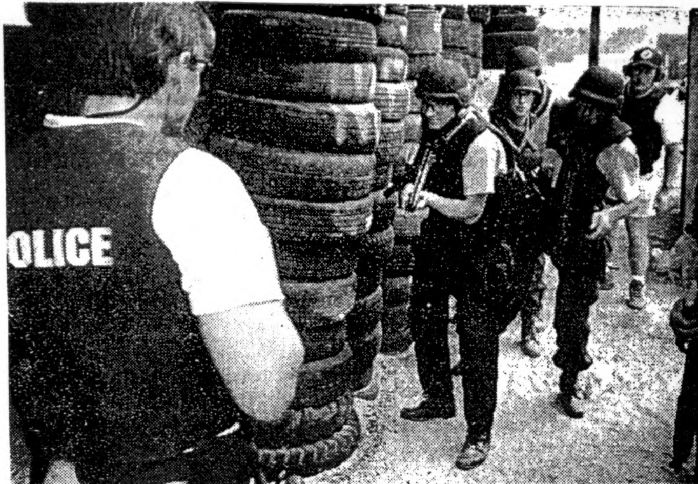
„Aro“ vyrai, vilkintys JAV specialiųjų tarnybų uniformą, puola tariamųjų teroristų buveinę.