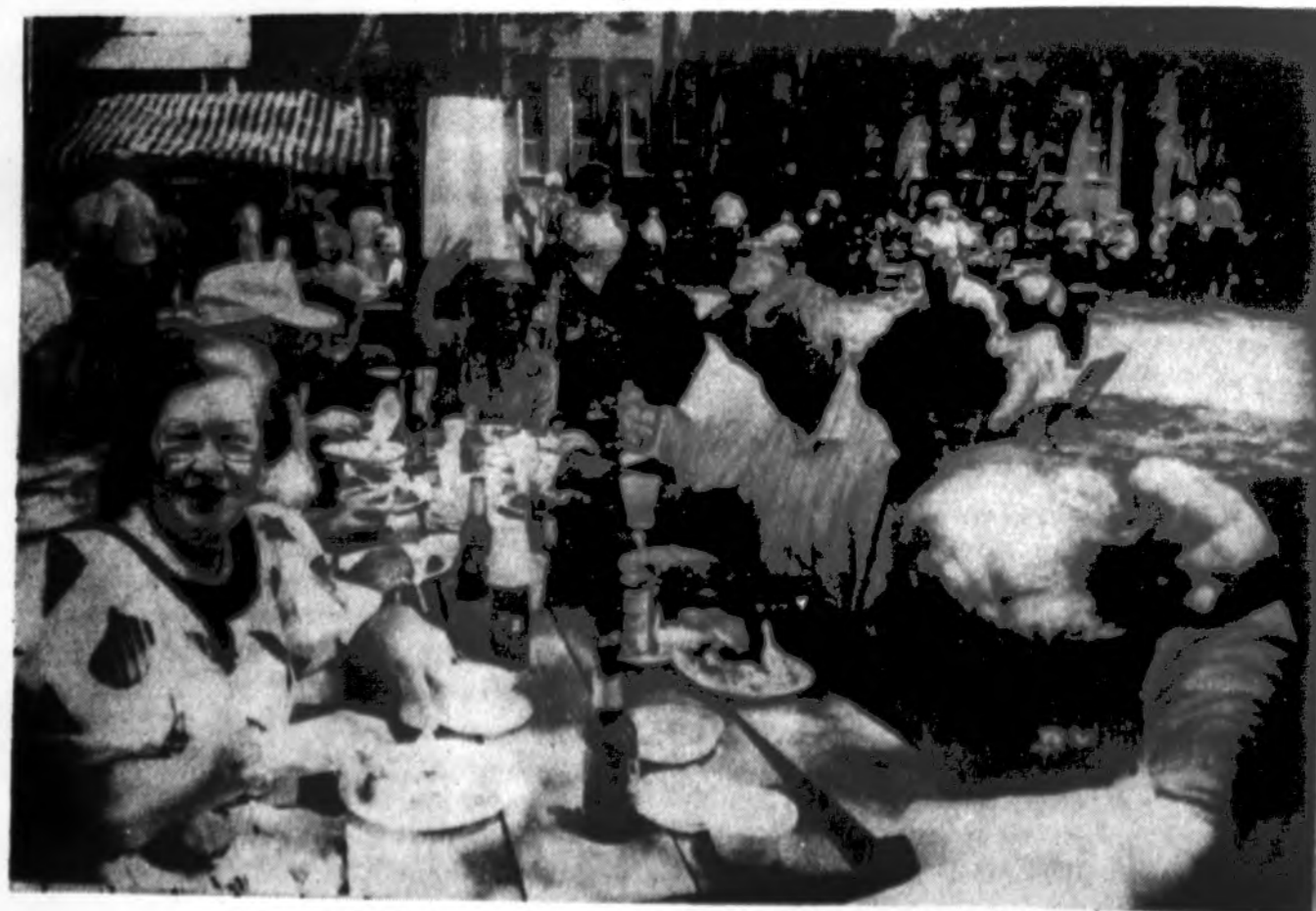
Svečiai Pasaulio lietuvių centro gegužinėje Lemonte liepos 9 d.