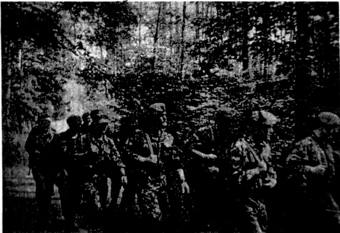
Prieš 50 metų šiais miško keleliais slapčia žygiavo Dzukijos partizanai (galbūt į Kalniškės mūšį...), o dabar šauiniai žengia lietuviai savanoriai, dalyvavę žygyje „Dzukija-95“.

• Niekad vienišas nebūsi, jeigu „Drauga“ parsiisiysi.