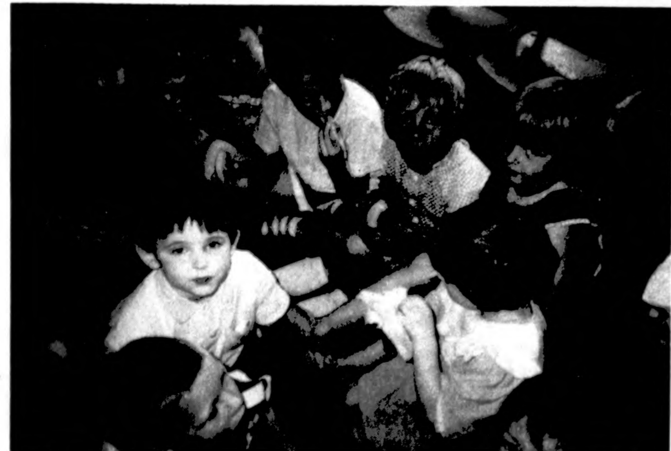
Antakalnio vaikų TB ligoninės jaunieji pacientai. Jiems vaistus taip pat siūnčia Lithuanian Mercy Lift.

AKIŲ CHIRURGIJA Good Samaritan Medical Center Naperville Campus 1020 E. Ogden Ave., Suite 310, Naperville IL 60563 Tel. 708-527-0090 Valandos pagal susitarimą