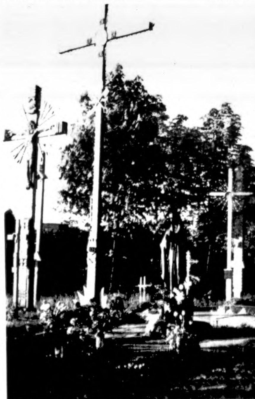
Dievo Motinos statula Kauno Kryžių kalnelyje yra visuomet labai gerbiama ir papuošta gėlemis. Greta statulos šv. Tevo Jono Pauliaus II Lietuvoje apsilankymo proga.