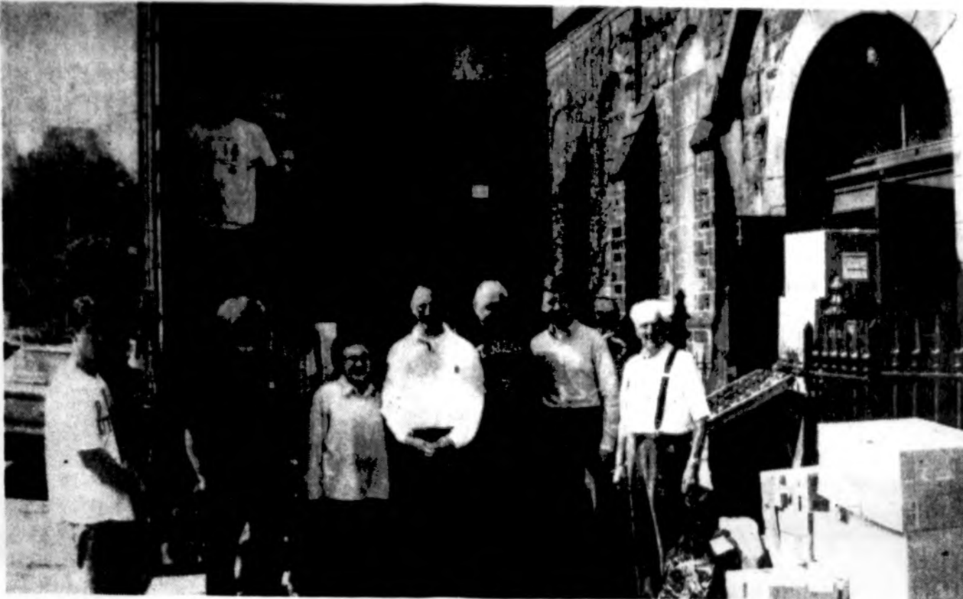
Philadelphijos lietuviai pakrovė tris talpintuvus labdaros siuntinių į Lietuvą.

Labiausiai išsiplėtusi organizacija yra JAV Lietuvių Bendruomenė, kuri gražiai tvarkosi demokratiniiais pagrindais. Pasiskirsčiusi įvairiomis sekcijomis, apima visą liuanistų veiklą. Gal būtų praktiškiausia ir dabartiniams ateiviams įjungti į šią organizaciją. Juk mūsų visų siekiai ir norai yra tie patys: išlikti liuanistais, padėti Lietuvai ir gerai ekonomiški, kai įsikurti. Visiems bendrai siekiant tų tikslų, lengviau būtų pasiekti. Naujieji tautiečiai turi ir specifinių siekimų