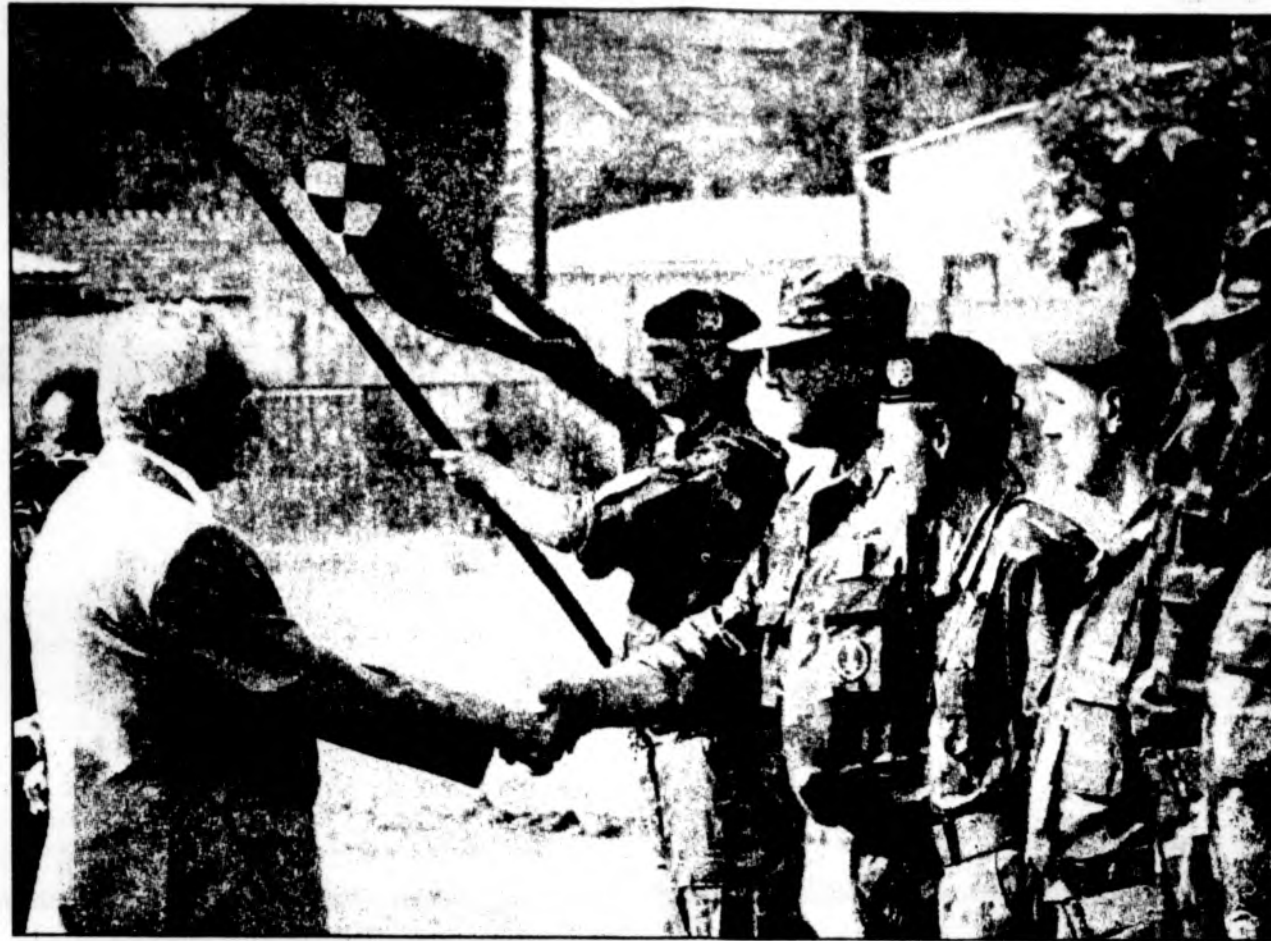
Kroatijos prezidentas Franjo Tudjman, sekmdienį atvykęs į serbų sostinę pavadintą Krajinos miestą Knin, su pergale sveikina kroatų kariuomenę, sėkmingai ji užkariavus. Kroatai Knin miestą užėmė šeštadienį.