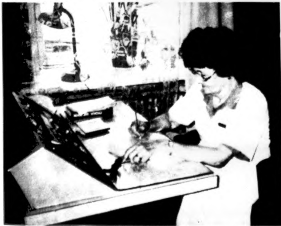
Greitosios Medicinos pagalbos stoties Vilniuje darbuotoja, priimanti skambinimus, kai žmonėms reikia pagalbos.

Good Samaritan Medical Center- Naperville Campus 1020 E. Ogden Ave., Suite 310, Naperville IL 60563 Tel. 708-527-0090 Valandos pagal susitarimą