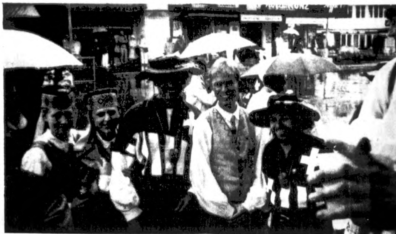
„Nemuno“ ansamblio nariai su Villars miestelio Šveicarijoje gyventojais.