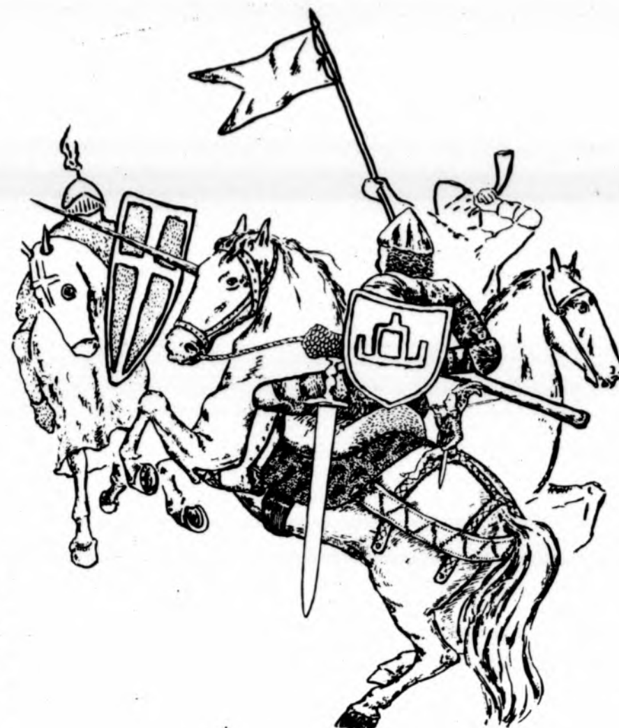
Vytautas Didysis Žalgirio mūšyje. Šiais metais Lietuvoje paminėtos 585 metinės.

tuvą 1987 metais. (A. Žukas, Respublika Nr. 204, Vilnius, 1994.IX.30).