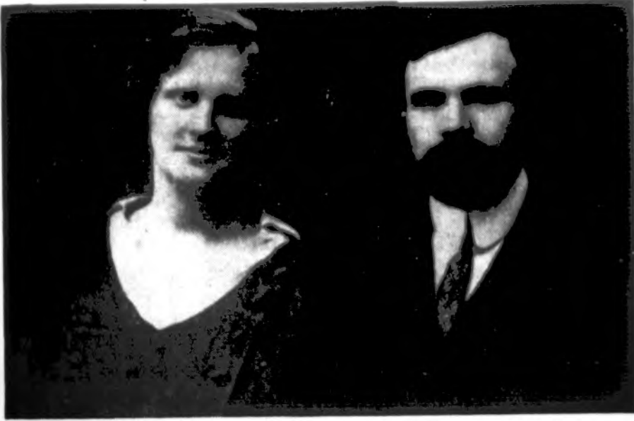
Martynas Yčas su žmona Hypatia (buv. Šliupaite) 1917 m.