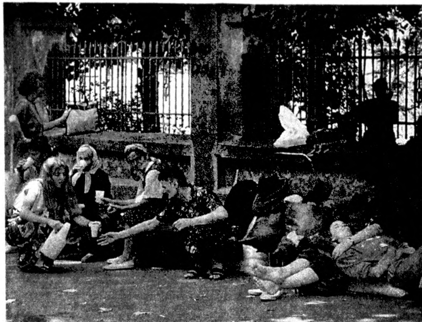
Serbijos sostinėje Belgrade serbai pabėgėliai iš Krajinos praėjusių sekmadienį laukė humanitarinės pagalbos. Tai didžiausia serbų migracija nuo dabartinio karo pradžios.

Chirac pareiškimas neatitinka jo pirmtako Francois Mitterrand politikos. Mitterrand atkakliai tvirtino, kad Prancūzijos Respublika neatsako už Vichy nusikaltimus, ir niekada žydų neatsiprašė.