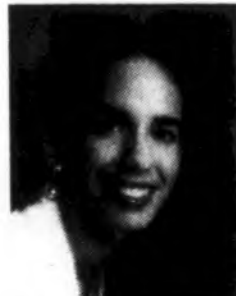
Nectaris Meirakos Stagg H.S.