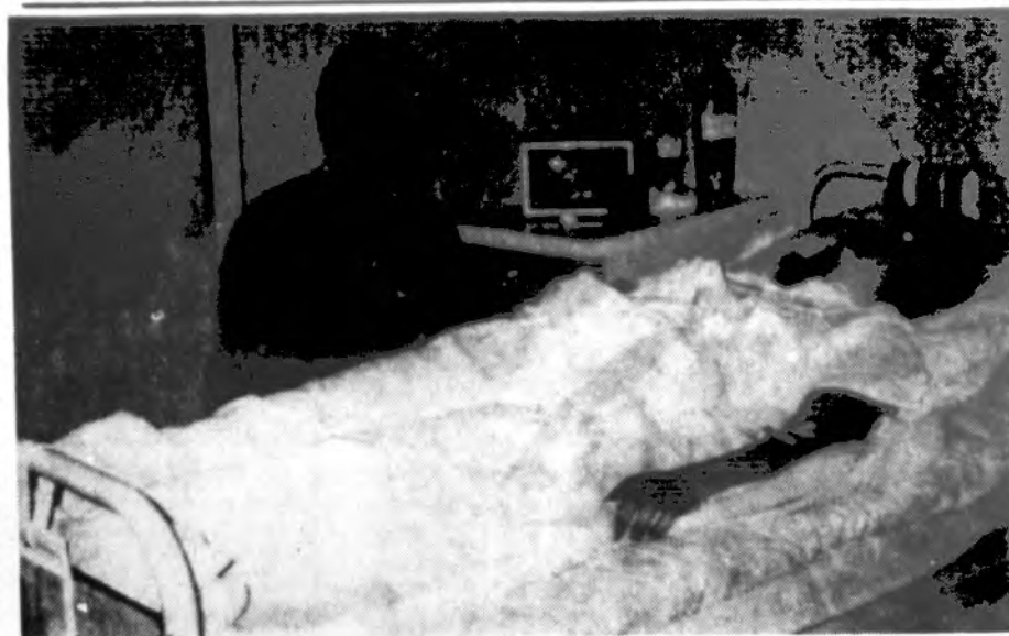
Greitosios pagalbos ligoninėje, Vilniuje.