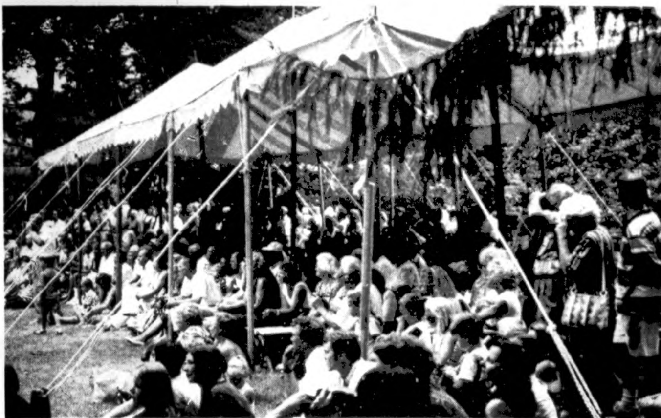
Putnamo metinėje šventėje gausiai susirinkę dalyviai.