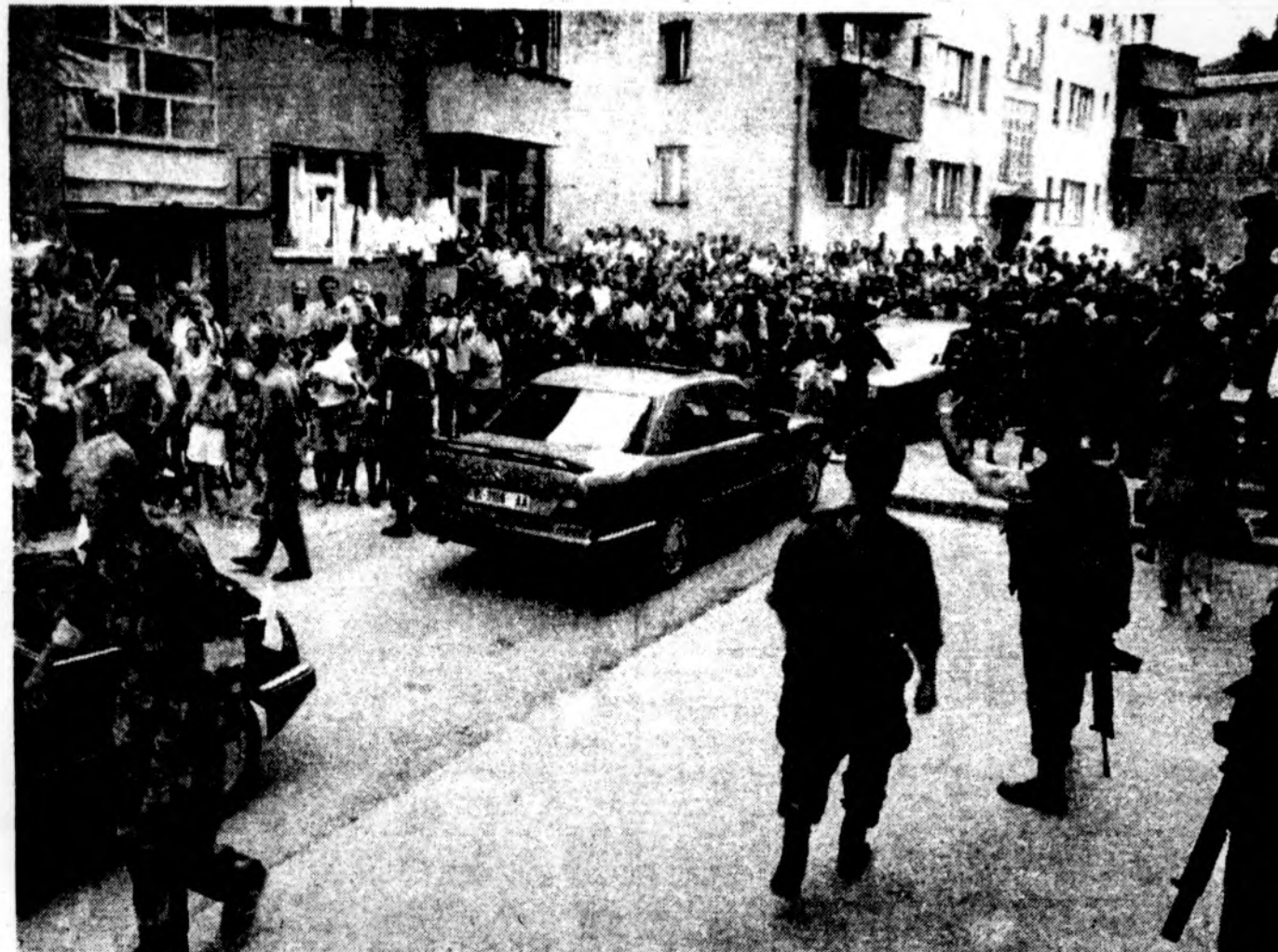
Bosnijos miesto Bihac gyventojai rugpjūčio 8 d. džiugiai rinkosi į gatves atšvęsti miesto išvadavimą nuo apsupty ir sutikti atvykstančią Bosnijos prezidentą Aliją Izetbegović. Kroatų ir Bosnijos kariuomenės bendromis jėgomis išvadavo miestą rugpjūčio 5-6 dienomis.

Televizijos laidų kalba bus tikrinama ir toliau. Artimiausiu metu ekspertai pradės klausyti sporto, meno laidų, taip pat laidų vaikams.