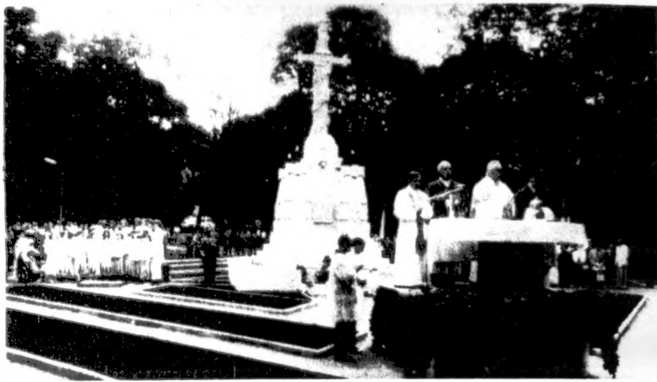
Kaune, Karmelitų kapinėse, birželio 14 d. paminklo „Žuvome už tėvynę“ atidengimo pamaldos.