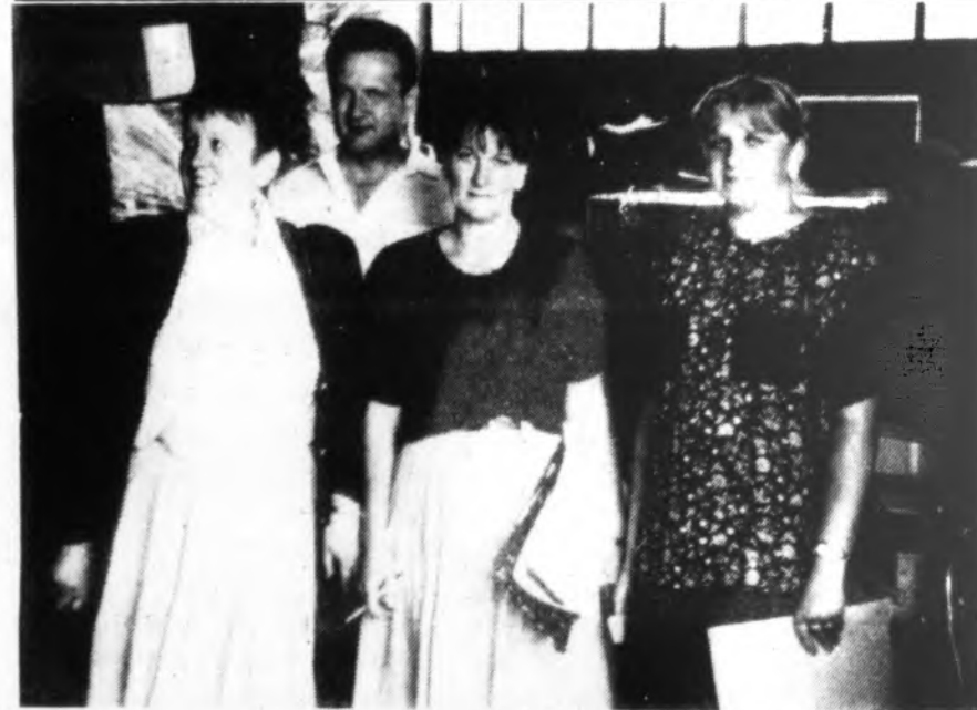
Sveikatos apsaugos ministerijos – SAM – sandėlyje, kai atvyksta nauja Lithuanian Mercy Lift siunta, judėjimas virte verda: iš kone visos Lietuvos suvažiuoja medicinos darbuotojai atsiūnti jiems skirtų medikamentų.