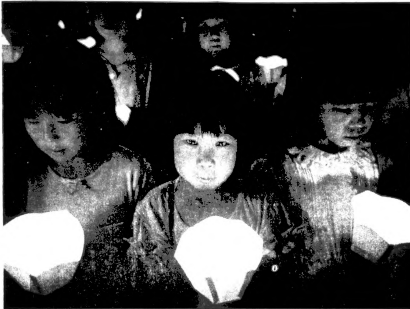
Praėjusį trečiadienį Nagasaki, Japonijoje, minint 50-ąją atominę bombą užpuolimo sukaktį, į eiseną išjungė vaikučių choras. Ta proga pasakytoje kalboje Nagasaki miesto meras pareiškė, kad pasaulis ignoruotų miesto prašymą, kad būtų sunaikinti branduoliniai ginklai, jei Japonija ir toliau vengs atsiprašyti už savo vaidmenį Antrajame pasauliniame kare. Tuo pačiu metu Japonijos ministras pirmininkas Tomichi Murayama pasakė, kad netrukus jis paskelbė atsiprašymą už Japonijos agresiją. Šio pareiškimo laukiama rugpjūčio 15 d., minint 50-ąją Japonijos kapituliacijos sukaktį.

Anksčiau LAL yra pardavęs maždaug 30 mažesnių lėktuvų ir malūnsparnių. Lėktuvus An-2 nupirko JAV ir Sudanas, vienas Tu-134 natūriniais mainais atiduotas Minskio lėktuvų remonto gamykli.