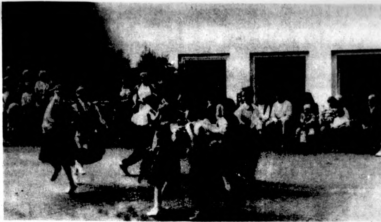
Vasario 16 gimnazijos Vokietijoje jaunieji mokiniai ir būsimieji gimnazistai šoka Joninių šventės programoje.