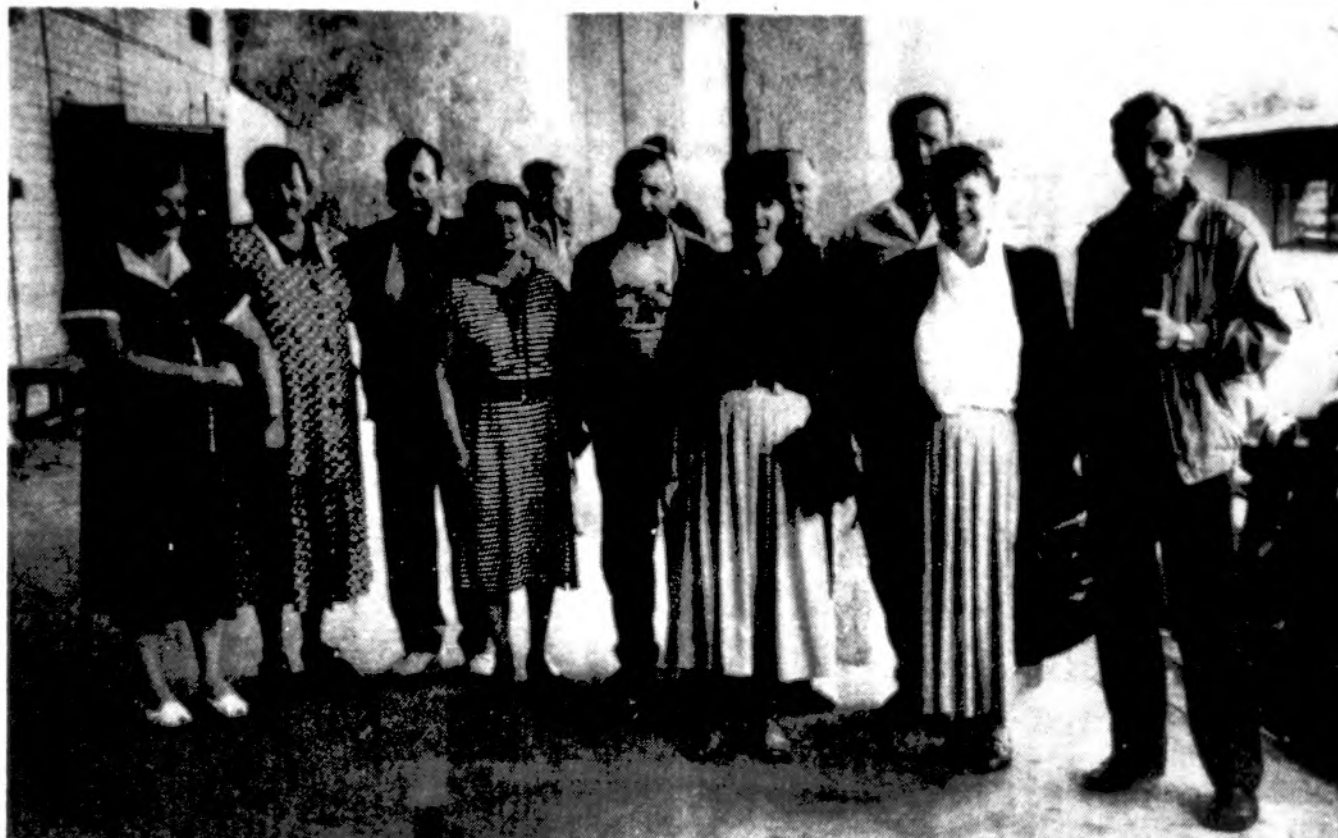
SAM (Sveikatos apsaugos ministerijos) sandėlyje suvažiavę medicinos darbuotojai iš Alantos, Ario-galos, Valkininkų, Panevėžio pasiimti Lithuanian Mercy Lift siūstų medikamentų.