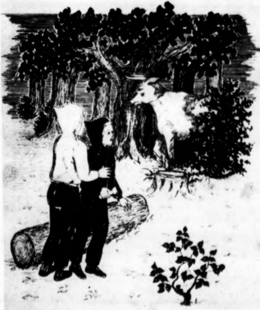
Paukščiųjų stovyklos sargybinės išgąsdinęs „dinozauras“ buvo tik taiki karvutė.