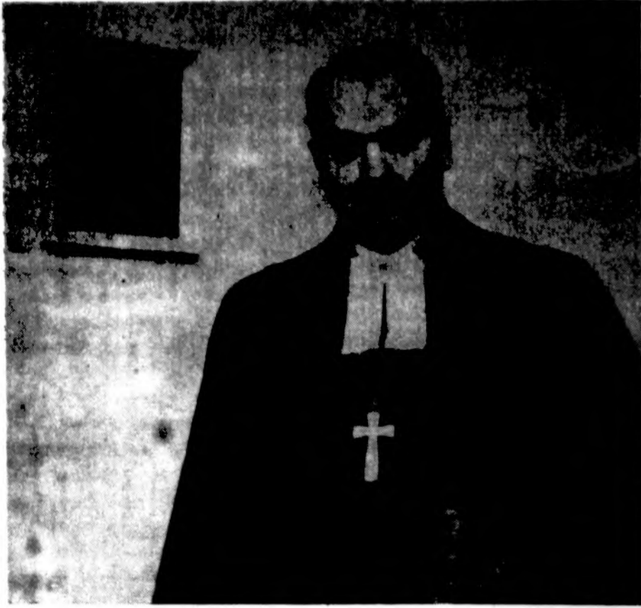
Ev. Reformatų kunigas, generalinis superintendantas kun. Povilas Dilys.