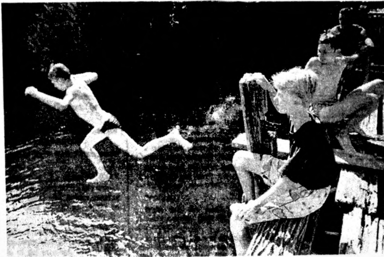
Kroatams išvadavus Bihadž nuo serbų apsausties, vaikai pirmą kartą gali pasimaudyti, nebūdami šaudymo. Pirmadienį JAV valstybės sekretoriaus pavaduotojo Richard Holbrooke vadovaujama delegacija, kuri Bosnijoje, Serbijoje ir Kroatijoje siūlys taikos planą. JAV plane siūloma iškeisti serbų apsuptą Goradžę į lengviau apginamą teritoriją prie Sarajevu. Bet Bosnijos prezidentas Alija Izetbegović telefonu JAV viceprezidentui Al Gore pasakė, kad niekuomet neatsisakys Goradžės, nors ir 15 metų ilgiau tektų kariauti dėl miesto. Be to, JAV siūlomame projekte, kurį patvirtino Rusija, Prancūzija, Vokietija ir Britanija, norima 51% Bosnijos atiduoti jos valdžiai, o 49% - serbams. Tai mažiau, negu dabar serbų užkariautas 70% Bosnijos plotas. Plane siūloma atimti ekonominę blokadą prieš Serbiją, jei siūlomas planas bus priimtas, ir bombarduoti serbų pozicijas NATO lėktuvais, jei plano nepriims.

Šiuo metu 21 šeima dar negali sugrįžti į Rusiją, nes išliko problemų dėl butų paskirstymo. Buvo sutarta, kad gyvenamojo ploto kiekviena šeima gaus tiek, kiek vienam gyventojui priklaus-