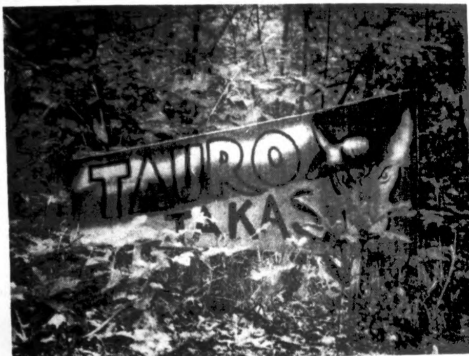
Takas Rako stovykloje.