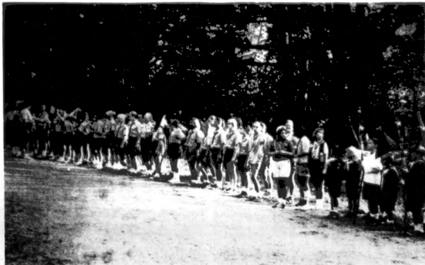
Rako stovykloje rikiuojamės vėliavų nuleidimui.