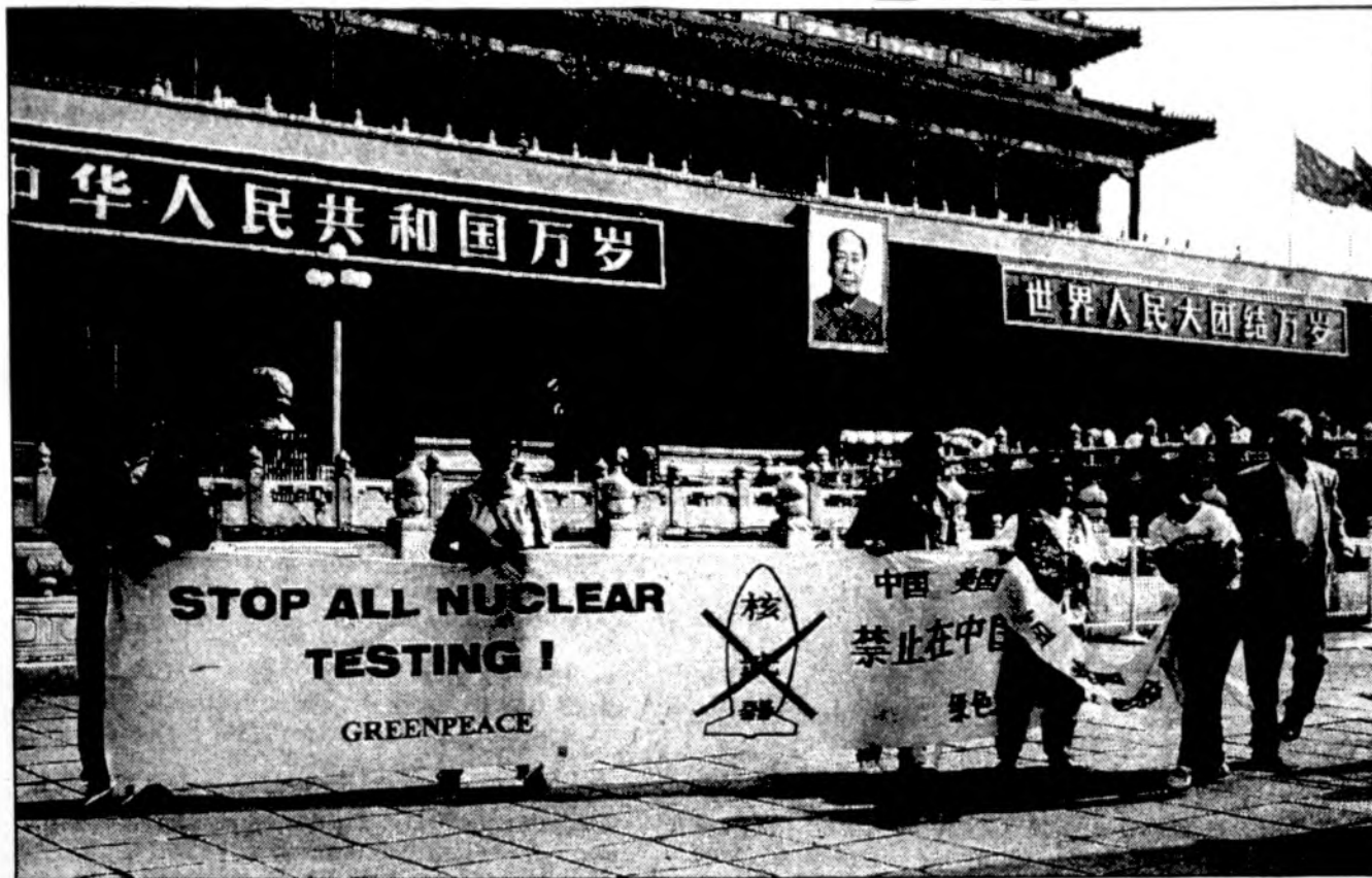
Tiananmen aikštėje Kinijos sostinėje Beidžinge gamtosaugininkų organizacijos Greenpeace atstovai, vakariečiai, staiga atskleidė transparentą, kuriame protestuojama prieš Kinijos planus vykdyti daugiau branduolinių ginklų bandymų. Civiliaiis drabužiais apsirengęs policininkas, paskui ir kiti tuoj pat iš protestuotojų rankų išplėšė transparentą ir suėmė juos, o kartu su jais ir du pasamdytus įvykiu filmuotojus. Anot Greenpeace atstovės Londono, suimtieji buvo nuvežti i netoli aikštės esanti viesbutį ir iš ten sekantią dieną būsia deportuoti i Hong Kongą. Vakarų diplomatas, kalbėdamas anonimiškai, pasakė, kad demonstruotojai jau paleisti, bet daugiau detalių nepranešė. Kinijos pareigūnai sako, kad demonstruotojai buvo suimti nes neturėjo leidimo. O leidimai rengti protesto demonstracijas neduodami.

Bandras žygio maršruto ilgis - apie 750 kilometrų, o per dieną numinta po 50-60 kilometrų. Bendrijos „Atgaja“ ir