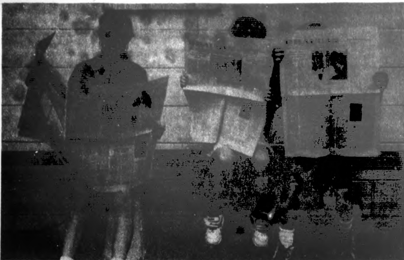
Draugystė su „Draugo“... Mokytojų studijų savaitėje, kuri praėjusi sekmadienį užsibaigė Dainavoje, patys jauniausi stovyklautojai domisi naujaisiomis naujienomis „Drauge“.

„Lituanicos“ futbolo klubo, šimtmetinio 46 metų veiklos sukaktį, metinė šventė – futbolo turnyras ir gegužinė šį šeštadienį, rugpjūčio 19 d., vyks Lemonte prie Lietuvių centro. Turnyre dalyvaus 9 komandos. Bus maisto, gėrimų ir geros muzikos (gros ir dainuos muz. A. Augustaitis). Pradžią 11 val. ryto. Šventė tęsis iki vėlumos. Visi klubo nariai, jų šeimos, futbolo mėgėjai ir visuomenė kviečiami kartu švęsti šio vienintelio JAV-se lietuviško futbolo klubo ilgametės veiklos sukaktį.