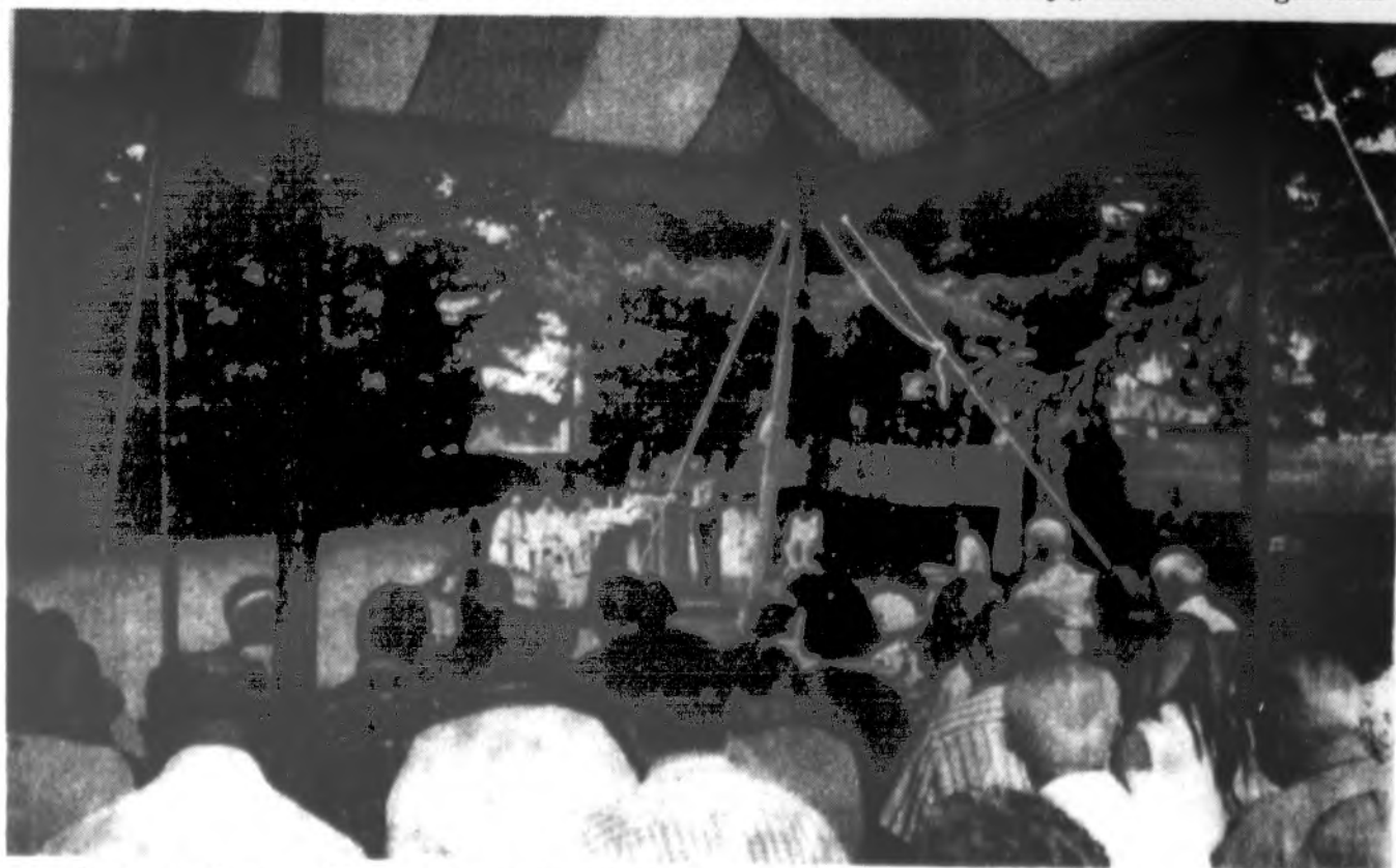
Šv. Mišios Putnam, CT, susitikimo su visuomene šventėje.