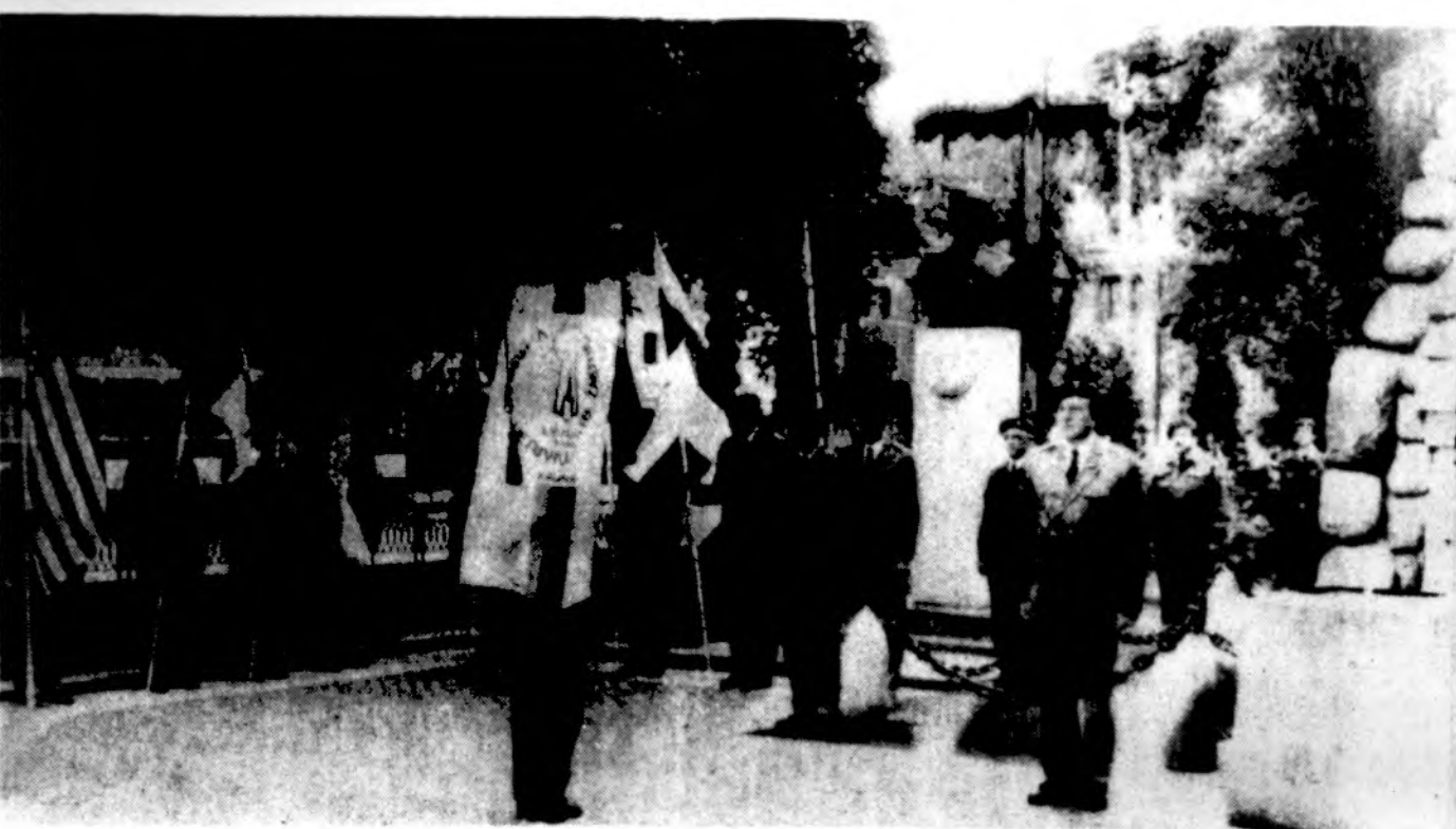
Penktųjų Pasaulio lietuvių sporto žaidynių simbolinis atidarymas Kaune, Vytauto Didžiojo Karo muziejaus sodelyje. Su žaidynių dalyvių vėliavomis išsiriakvė SKATo Kauno igulos savanoriai.

Čikagiečiai buvo pareiškę norą varžytis su vyrų grupės