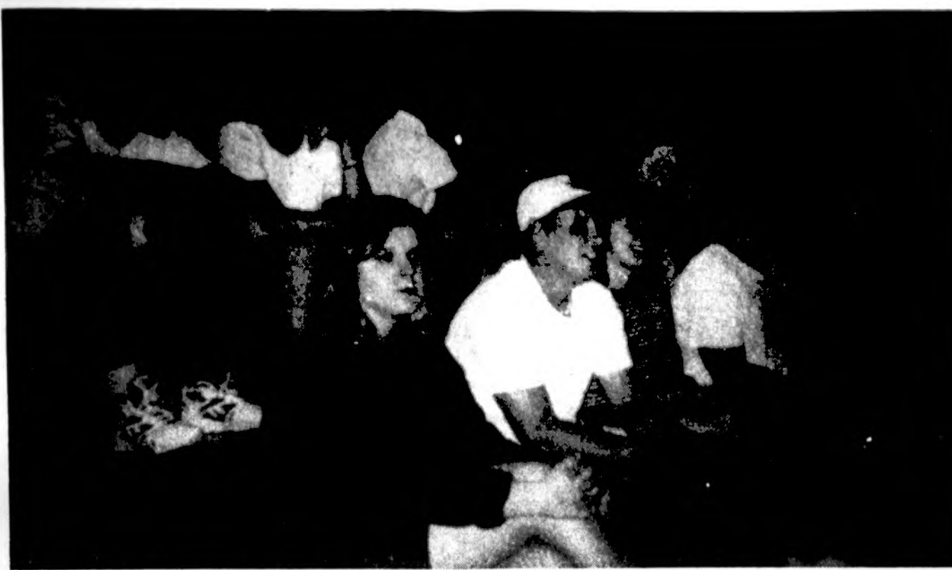
ŠALFAS s-gos metinėmis žaidynėmis, Clevelande vykusiomis š.m. gegužės 19-21 d., buvo gyvas visuomenės susidomėjimas. Nuotraukoje – dalis susidomėjusių stebėtojų.