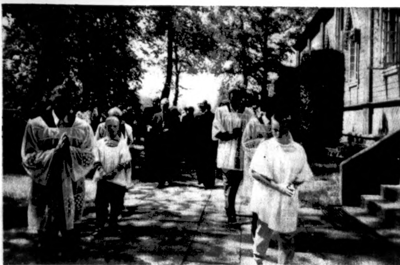
Procesija Vilniuje, teikiant Sutvirtinimo sakramentą.

Vitaminas E tirpsta riebaluose, todėl tie, kurie valgo mažai riebalų turintį maistą, mažiau gauna vitamino E. Tokiems reikia papildomai imti vitaminą E.