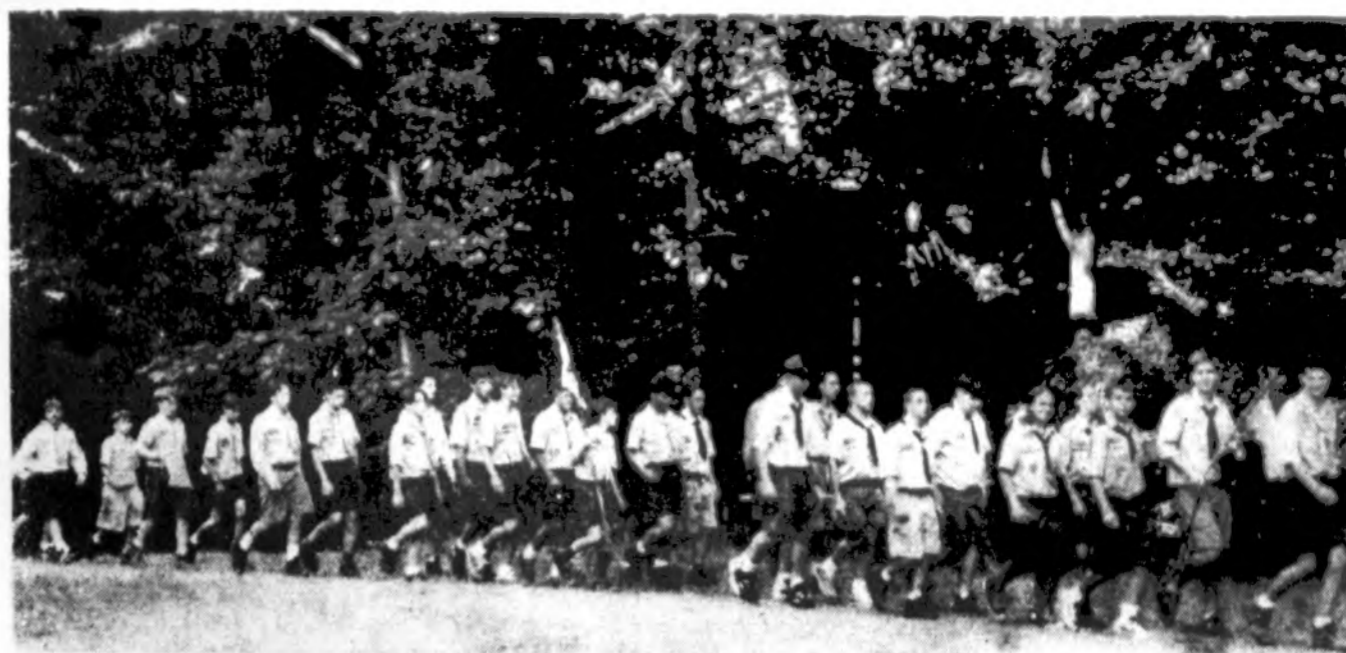
Brolių skautų gretos šią vasarą Rako stovykloje.