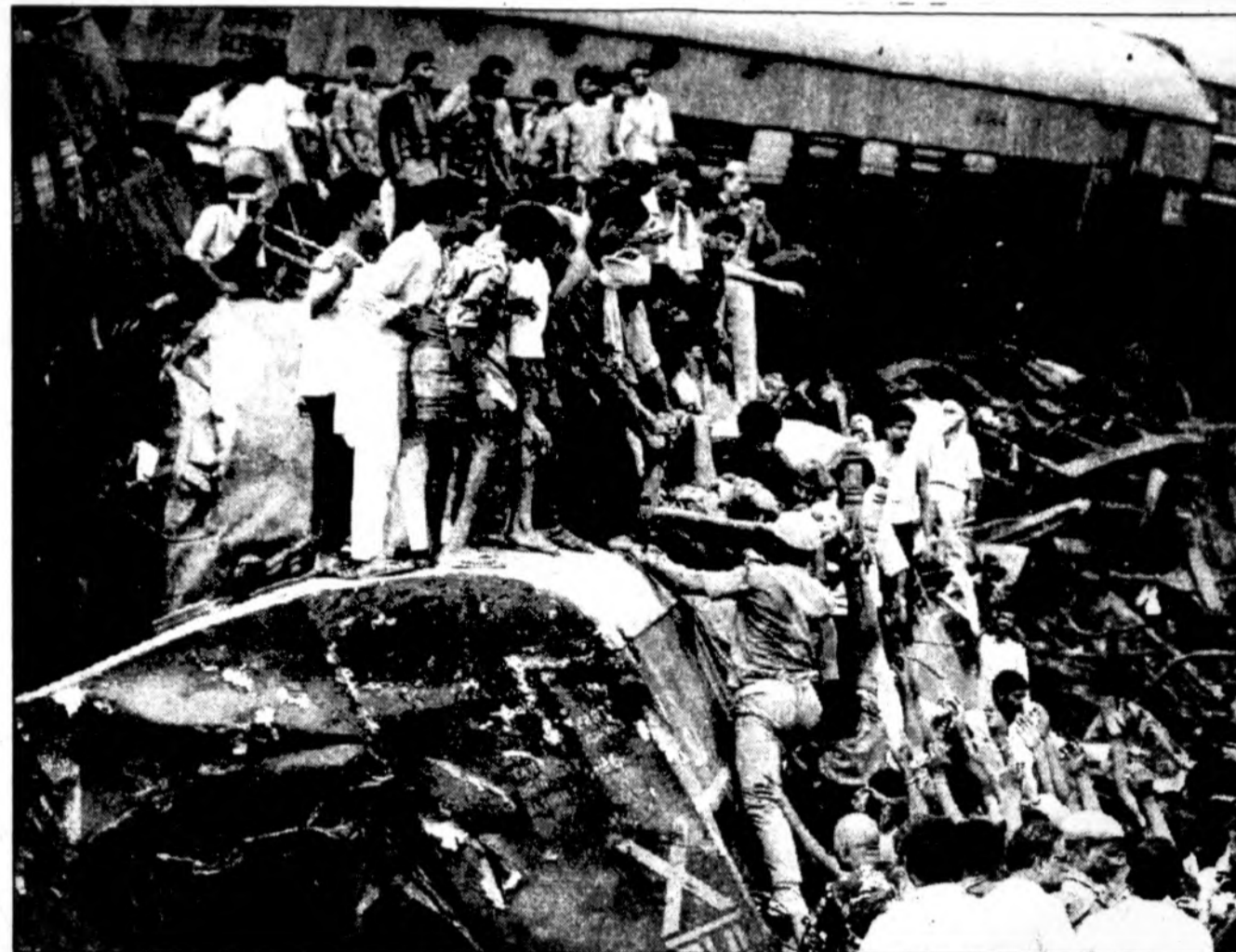
300 žmonių buvo užmušti ir 400 sužeisti apie 3 val. ryto sekmadienį šiaurinėje Indijoje, netoli sostinės New Delhi, kai vienas greitasis traukinys visu greičiu įvažiavo į stovintį traukinį. Nelaimė įvyko kai pirmam traukiniui užvažiavus ant karvės jis negalėjo toliau važiuoti, nes karvė buvo įsipainiojusi į jo stabdžius. Geležinkelio išmininkas, negavęs žinios apie stovintį traukinį, neįspėjo apie tai po jo važiuojančio greitojo traukinio. Pirmame traukinyje buvo apie 1,300 keleivių, ant rame — apie 900; nelaimės metu daugumas keleivių miegojo. Ši avarija buvo didžiausia Indijos traukinių istorijoje. Indijos geležinkelių sistema yra ketvirtoji didžiausia pasaulyje, bet labai lėtai modernizuojama — daugumoje dar neturi kompiuterizuotos signalizacijos.

Burundis yra viena iš nedidelių centrinės Afrikos valstybių. Apie 28,000 kvadratinį kilometrų užimančioje šalyje (Lietuvos teritorija — 65,000 kv. km) gyvena beveik 5 milijonai žmonių. Šalyje vyksta ginkluoti konfliktai tarp Tutsi ir Hutu genčių. Tačiau, kaip pasakė ambasadorius, po užpernai įvykusių rinkimų į Nacionalinę