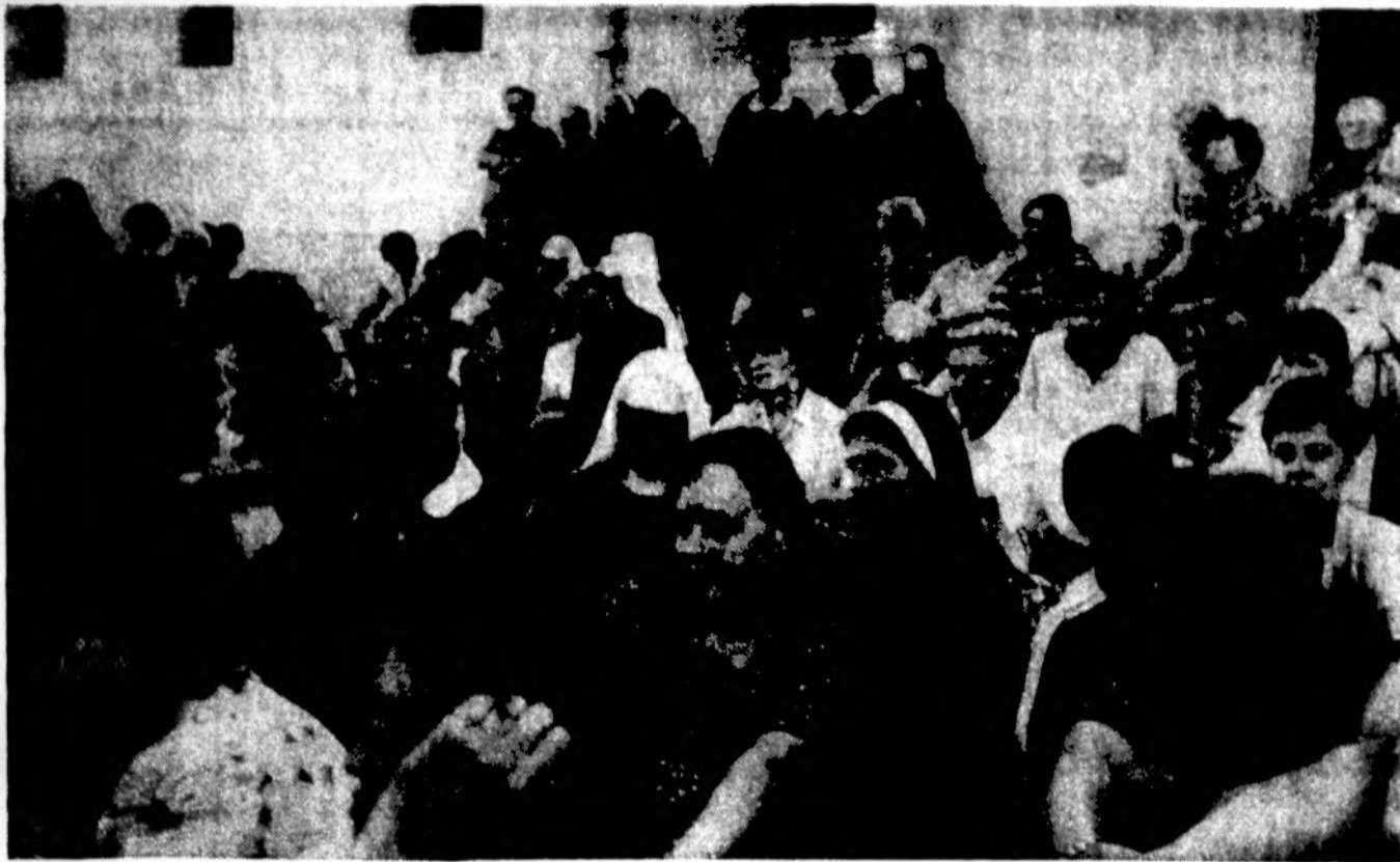
P. F. Hendelio „Mesijas“ – koncertas Kauno Pažaislio vienuolyne šią vasarą.