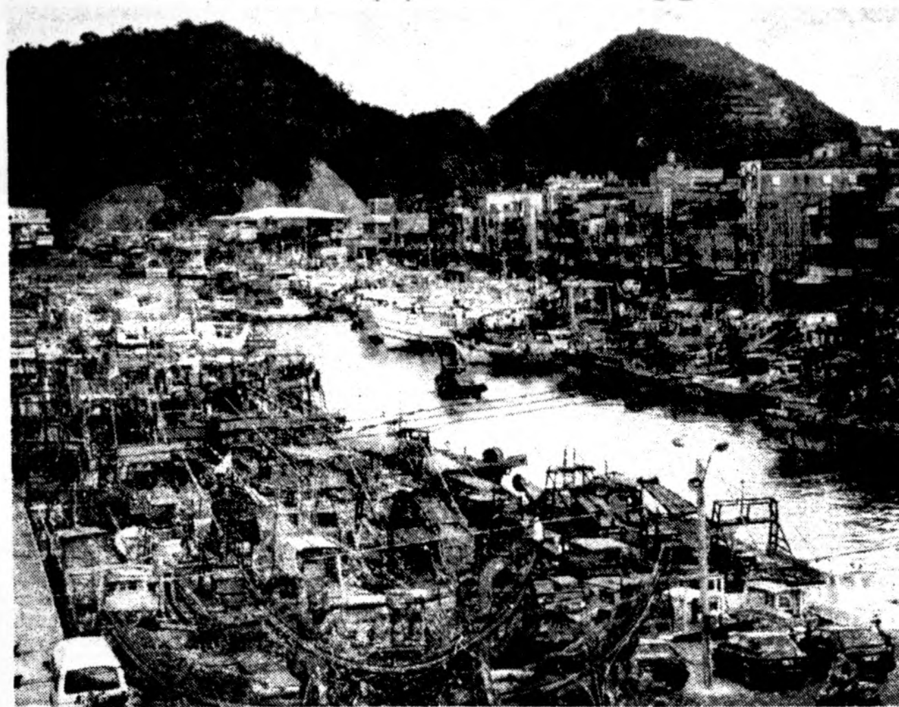
Keli šimtai taivaniečių žvejų laivelių atsikako iš Suao uosto šiaurinėje Taivano pakrantėje, nes jie bijo, kad Kinija nepradėtų raketų bandymų prie Taivano siaurinės pakrantės. Kinija tais bandymais nori priversti Taivaną siekti vieningos Kinijos. Kinija bijo, kad Taivanas atsikako vienybės su Kinija ir siekia visiškai nepriklausomybės bei tarptautinio pripažinimo kaip nepriklausoma valstybė.

Premjeras sakė, kad vyriausybė ketina kompensuoti žmonių indėlius, laikytus tik tuose subankrutavusiuose bankuose, kurie turėjo Lietuvos