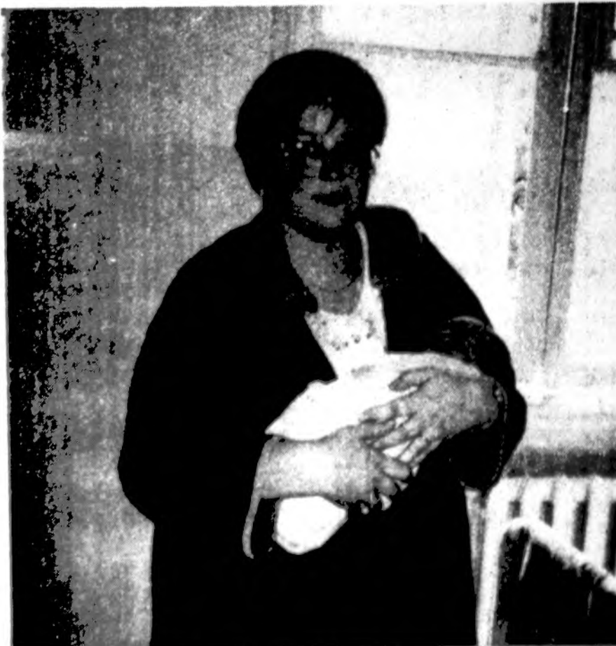
Naujagimis su mama Šv. Jokūbo ligoninėje Vilniuje š. m. birželio mėn.

Pastaba. Užsakant knygas paštu, pinigų nesiųsti. Sumokėsite gavę sąskaitą, kurioje bus pridėta pasiuntimo išlaidos. Illinois gyventojams pridėdama State Sale Tax 8.75% nuo knygos kainos.