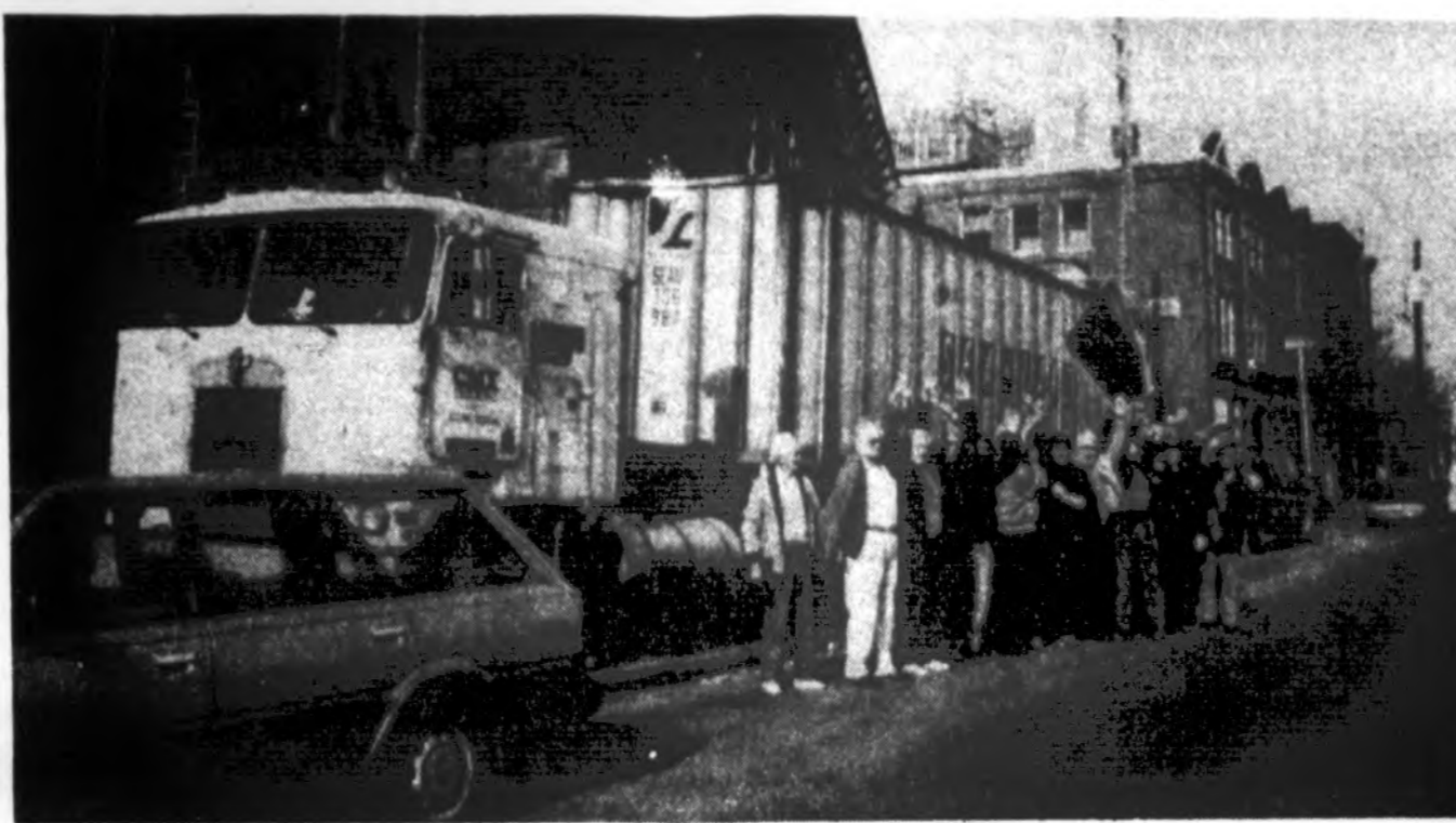
BALFo Philadelphia skyriaus veikėjai-direktoriai su talkininkais prie Šv. Andriejaus parapijos bažnyčios išlydi pirmąjį, skyriaus suorganizuotą, šalpos talpintuvų Lietuvos Politinių kalinių ir tremtinių sąjungai.

būrį Onučių, kurias artimieji draugai visuomet pasveikina vardadienio proga, būreliais pabendrauja, švėsdami jų vardines.