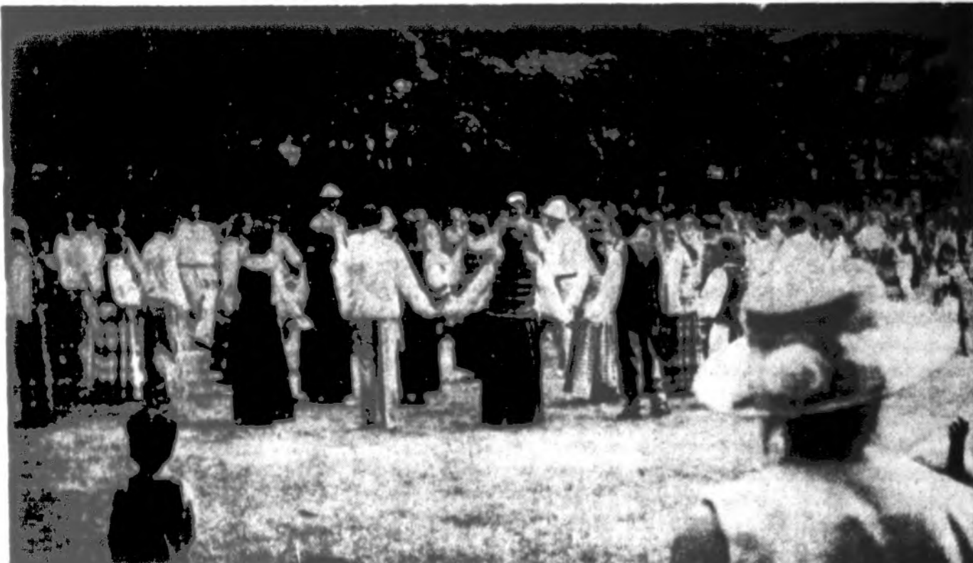
„Neringos“ stovyklos stovyklautojai atlieka programą Putnamo metinėje šventėje.