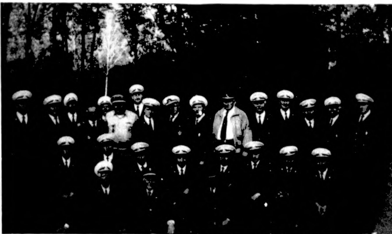
Kretingos skyriaus Lietuvos Šaulių sąjungos pulkas su svečiais šauliais iš JAV, šią vasarą besi- lankančiais tėvyneje.