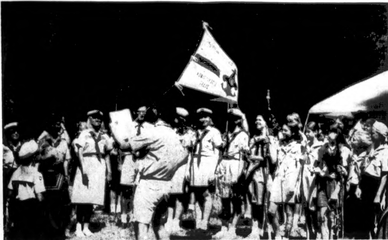
Jūrų skautiškų pastovyklės denyje, „Miško aidų“ stovykloje, Rake, keliami gairė.