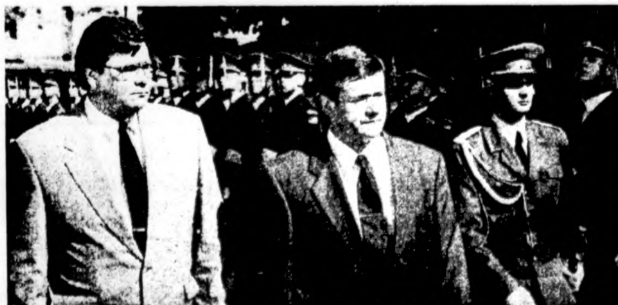
Rugpjūčio 28 d. atvykęs į Lietuvą, Lenkijos gynybos ministras Zbigniew Okonski (dešinėje) ir Lietuvos krašto apsaugos ministras Linas Linkevičius (kairėje) apėina garbės sargybą. Paklaustas, kaip Lenkija žiūrėtų į Lietuvos narys ties susijungiant su NATO, jei Lenkijoje pasikeistų prezidentas, Okonski pasakė, kad pati priimta į NATO, Lenkija tuoj pat siektų ir Lietuvos priėmimo.

Rugsėjo 14 d.: Šv. Kryžiaus išaukštinimas; Krescencijus, Notburga, Zubrys, Asta.