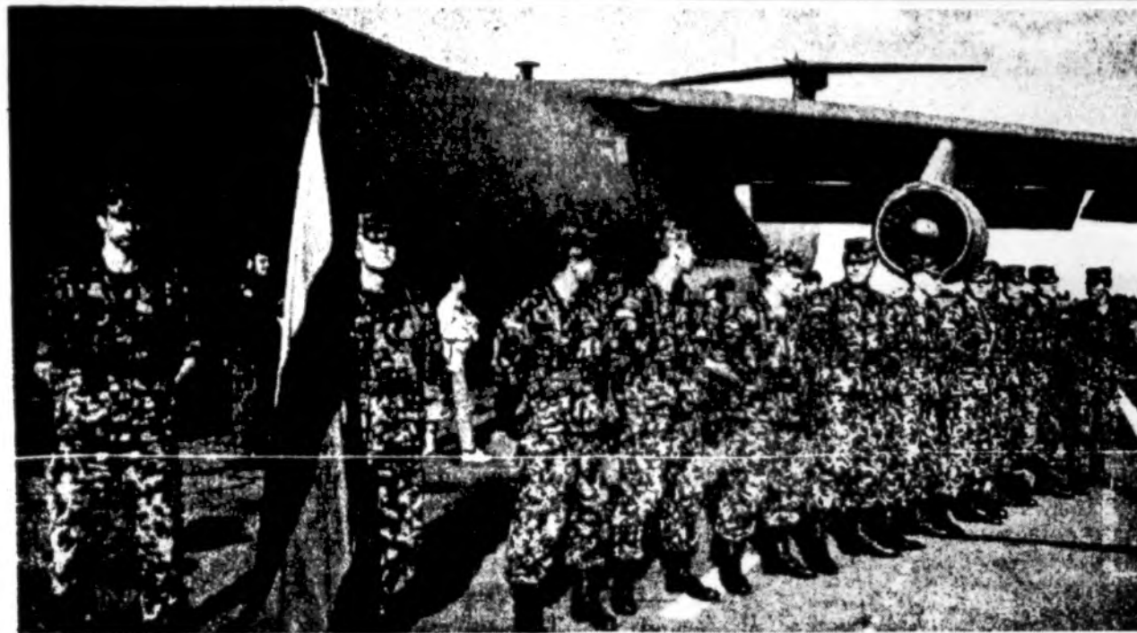
Rugpjūčio 28 d., grįžė iš tarptautinių karo pratybų Fort Polk, Louisiana, Lietuvos 25 kariūnai ir penki karininkai išsirikavo, prieš susitikdami su juos pasitikti atvykusiais giminėmis bei artimaisiais. Jie buvo neįpratę prie kone 120 F laipsnių pasiekiančio tvankaus klimato. Vienas kariūnas sakėsi labiausiai pasilgęs švelnios Lietuvos saulės, labai nustebinęs šiltais amerikiečių priėmimais.

Socialdemokratai ne kartą kelė viešumon faktus apie abejotinus vyriausybės sprendimus, skirstant didelius kreditus, neatsakingai naudojant užsienio paskolas ir panašiai. Visa tai buvo išdėstyta socialdemokratų nepasitikėjimo LDDP vyriausybe dokumente 1994 m., tačiau, pasak A. Sakalo, iki šiol į tai neatsakyta.