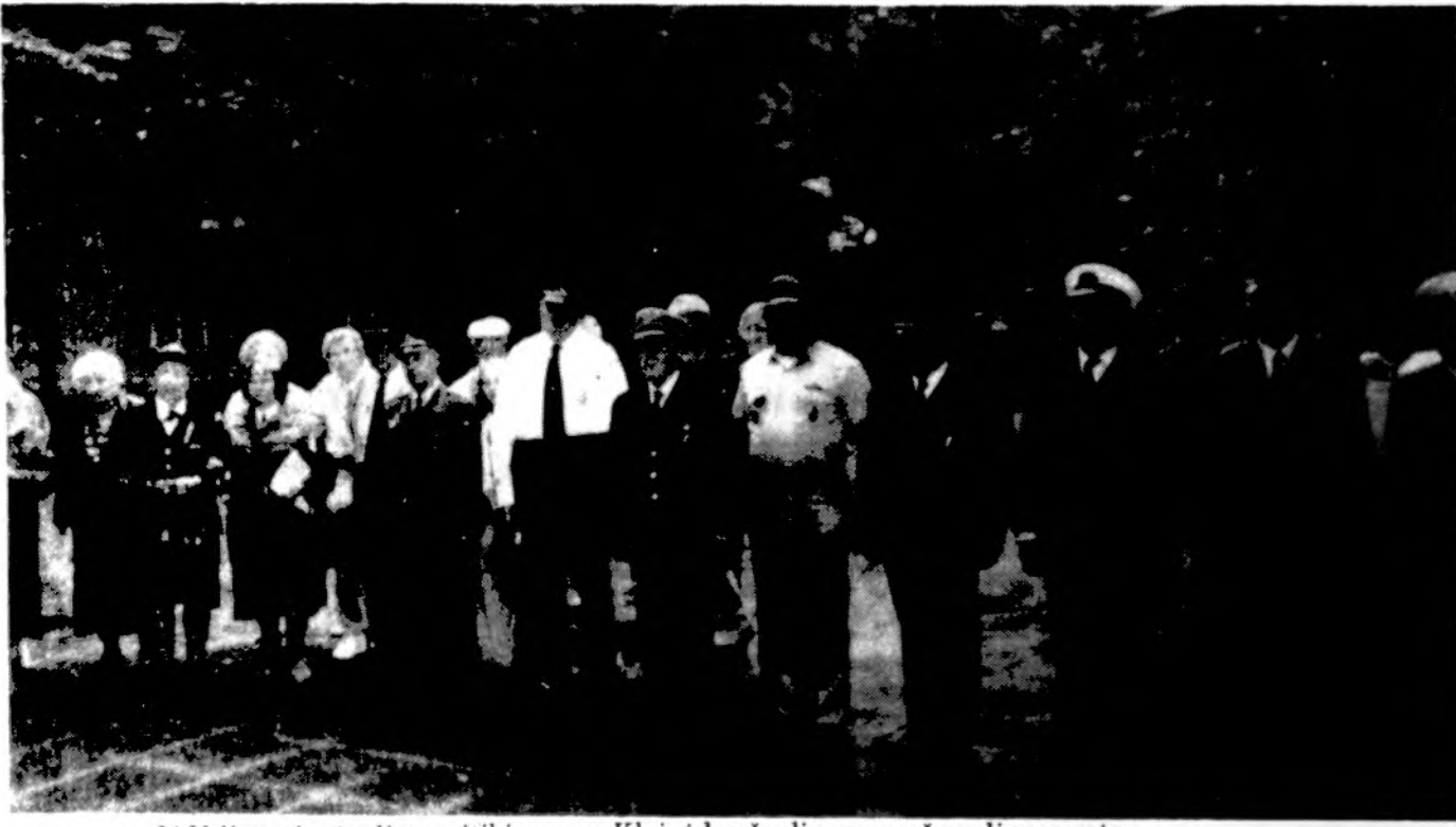
JAV lietuvių šaulių susitikimas su Klaipėdos šaulių grupe š.m. liepos mėn.

„Juodojo riterio“ patiekalų receptai paimti iš vokiečių, prancūzų ir lietuvių virtuvių. Vokiečių partneriai į restoraną investavo pusę milijono dolerių.