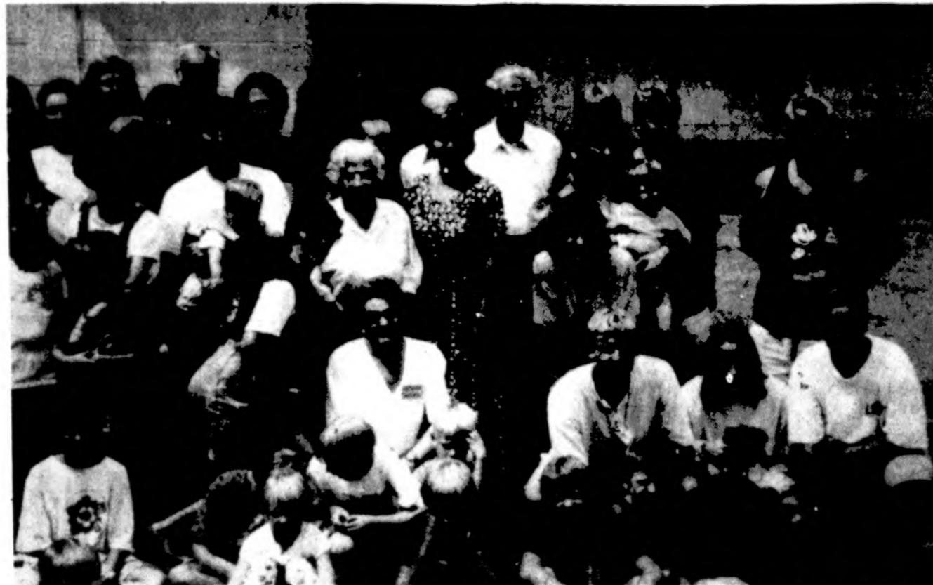
Čia tik dalelė susirinkusiųjų Mokytojų studijų ir poilsio savaitę Dainavoje šią vasarą; visi jokiū būdu būtų į vieną nuotrauką netilpę...

Ne tik specialiųjų mokyklų pedagogai, bet ir bendrojo lavinimo mokyklų mokytojai ėmė giliau studijuoti integracijos problemas. Lietuvoje jau yra labai gražių pavyzdžių, kai bendrojo lavinimo mokykloje mokosi vaikai, turintys fizinę ir