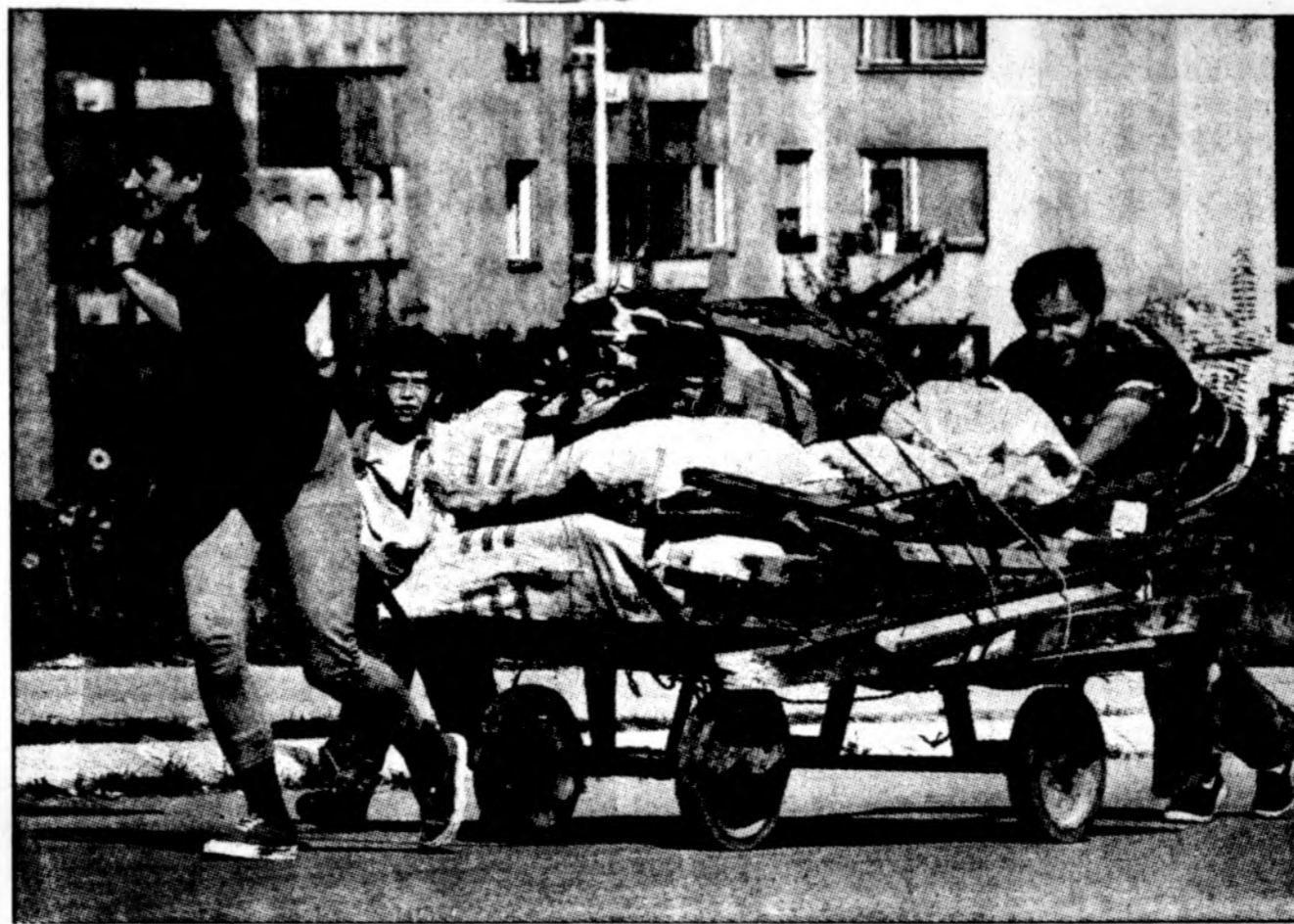
Sarajeve antradienį šeima vežasi malkų vežimą žiemai, naudodamasi NATO bombardavimo laimėta apsauga nuo serbų šaudymo. Jungtinių Tautų Saugumo Taryboje Rusija bombardavimą pavadino genocidu prieš Bosnijos serbus.

JAV armijos veterano požiūriu, ypač reikšmingas Baltijos šalių taikos palaikymo bataliono kūrimas. Jis taip pat labai vertino taikos palaikymo misijose Kroatijoje įgytą Lietuvos karių patyrimą.