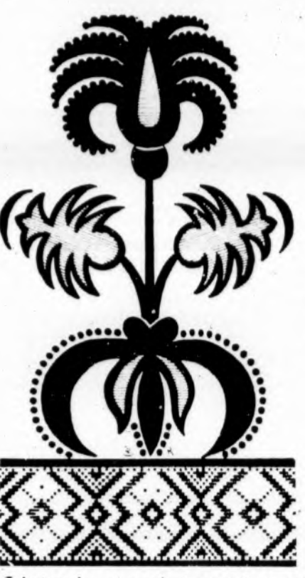
Lietuvių tautinė puošmena (tautodaile)