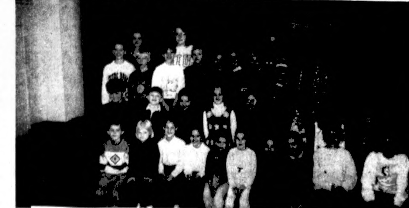
Čikagos lietuštinės mokyklos mokiniai, dalyvavę deklamavimo konkurse, kuris įvyko lapkričio 19 d.

Visi Dainavos stovyklautojai (Dainavos pasakų pilies laikraštėlis. 1994 JAS stovykla)